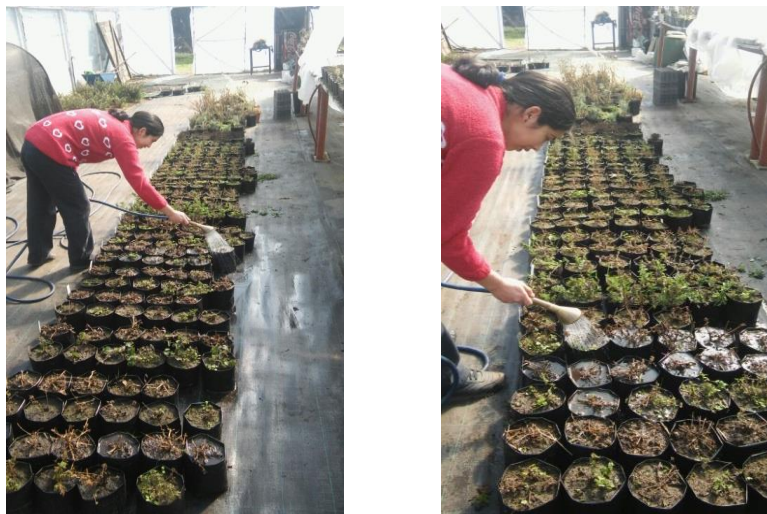
Figura 16. Actividad de fertilización. Izquierda: riego de macetas con fertilizante. Derecha: detalle del llenado de las macetas.

Fertilización: Se utilizó un inyector de fertilizante (dosatron). Se aplicó fertilizante hakaphos verde, con una dosis de 150 ppm semanalmente. Se aplicó en forma manual, cuando se llenaba una maceta y se pasaba a la siguiente (Figura 16).