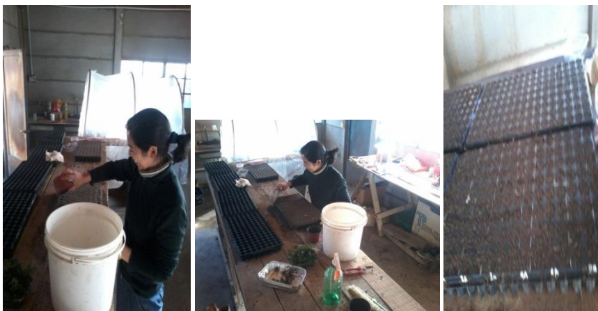
Figura 9. Preparación de bandejas para propagación de esquejes. Izquierda: llenado de bandejas con sustrato. Centro: Enraizado de sustrato en bandejas. Derecha: Bandejas con sustrato húmedo.

Los plugs se llenaron con el sustrato, se enrasaron, para luego humedecerlos (Figura 9).