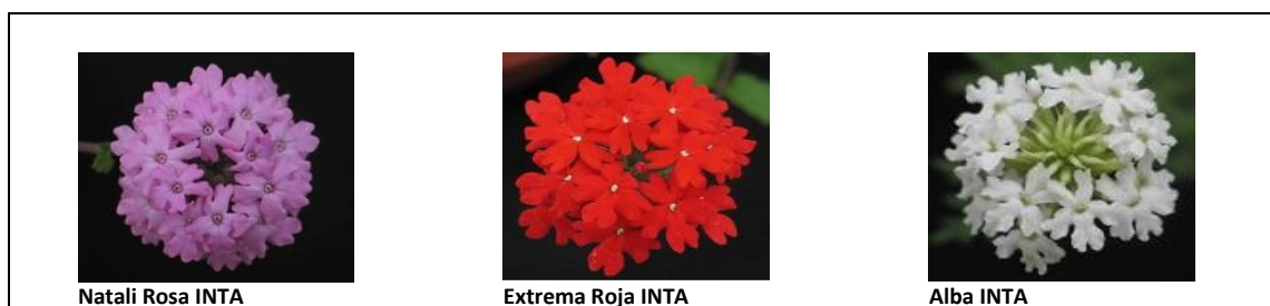
Figura 2. Variedades de Glandularia registradas por INTA al momento de realizar la práctica (Bologna, 2015).

De acuerdo con la ficha técnica de INTA esta variedad se multiplica vegetativamente a través de esquejes.