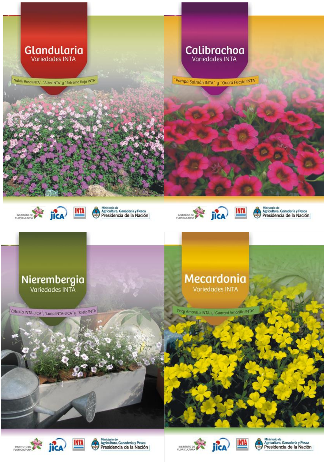
Figura 1. Tapa de manuales de cultivo de variedades INTA (Bologna, 2015; Hagiwara y Pannuncio, 2015; Soto, 2013; Greppi y Coviella, 2013)