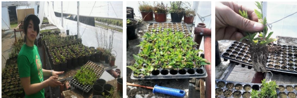
Figura 14. Repique de esquejes. Izquierda: preparación de las macetas. Centro: plug con esquejes provenientes de INTA Castelar. Derecha: detalle de esquejes enraizados en INTA Bariloche

Para esta actividad de la práctica, se trabajó con la variedad Glandularia "13224#7". Se utilizaron 29 esquejes de 2 meses, enraizadas en el INTA Bariloche durante la etapa anterior de la práctica, y 92 esquejes de 1 mes, enraizadas en INTA Bariloche con esquejes obtenidos a partir de plantas madres cultivadas en INTA Castelar. Todos los esquejes fueron enraizados en bandejas de 128 celdas con sustrato descrito en la etapa anterior, bajo condiciones de invernadero sin calefacción (Figura 14).