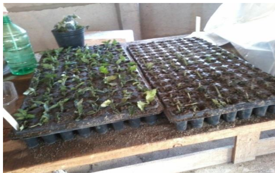
Figura 13. Bandejas rotuladas con esquejes de Glandularia en sector calefaccionado, julio de 2016

Las bandejas fueron dispuestas en dos áreas diferentes: