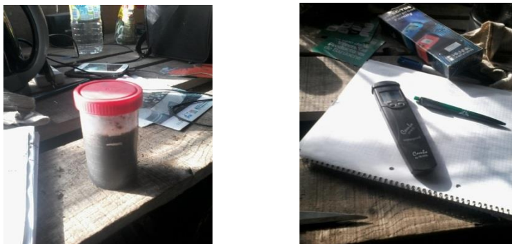
Figura 8. Instrumental utilizado para la determinación de pH y CE del sustrato. Izquierda: Recipiente con 3 partes de agua destilada y 1 parte de sustrato para ser analizado según técnica del INTA. Derecha: Phmetro-conductímetro sobre cuaderno de campo.

Los plugs se llenaron con el sustrato, se enrasaron, para luego humedecerlos (Figura 9).