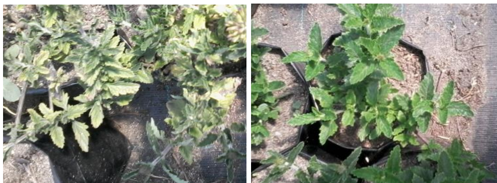
Figura 17. Plantas de Glandularia 13224#7, octubre de 2016. Izquierda: plantas con evidencia de clorosis. Derecha: Plantas con buen vigor.

En el mes de octubre, se observó un 40% de plantas de Glandularia 13224 # 7 con clorosis en la base del follaje (Figura 17).