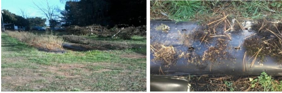
Figura 4. Canteros de cultivo al aire libre en el INTA Bariloche, junio de 2016. Izquierda: Parcela de cultivo. Derecha: Vista superior de los canteros y plantas con bajo vigor a final de cultivo.

Se procedió a levantar las plantas del cantero al aire libre y se realizó una poda de raíces para su trasplante a un contenedor. Las plantas fueron envasadas en macetas de bolsa plástica negra de 20 x 25cm (2,7 litros) con sustrato mezcla de 50% de tierra y 50% de arena volcánica; el sustrato fue elaborado junto al técnico a cargo del sector (Figura 5). Las macetas fueron rotuladas y ubicadas sobre el piso, de un invernadero sin calefacción (Figura 6).