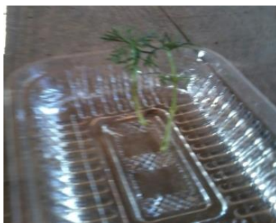
Figura 12. Esquejes de variedad "Alba INTA" en remojo en hormona líquida ANA disolución 1:3 en agua.

Los esquejes se remojaron en hormona líquida ANA (ácido naftalenacético 0,10g Inertes y coadyuvantes c.sp 100g) en disolución 1/3 (600ml de hormona/2000ml de agua) (Figura 12). Los esquejes se dejaron con su base en remojo durante 15 minutos.