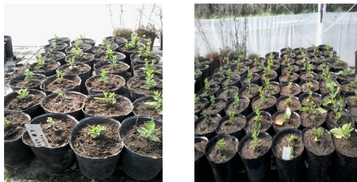
Figura 15. Izquierda: detalle de esquejes enraizados en INTA Bariloche. Derecha: detalle de esquejes provenientes de INTA Castelar enraizados en INTA Bariloche.

A fines de septiembre, se trasplantaron los esquejes enraizados a macetas de plástico soplado de 3 litros con sustrato compuesto por 30% de arena volcánica y 70% de suelo, preparado por el técnico a cargo del sector. Las macetas se ubicaron sobre mesadas dentro del invernadero, con rótulo indicando variedad y fecha de repique (Figura 15).