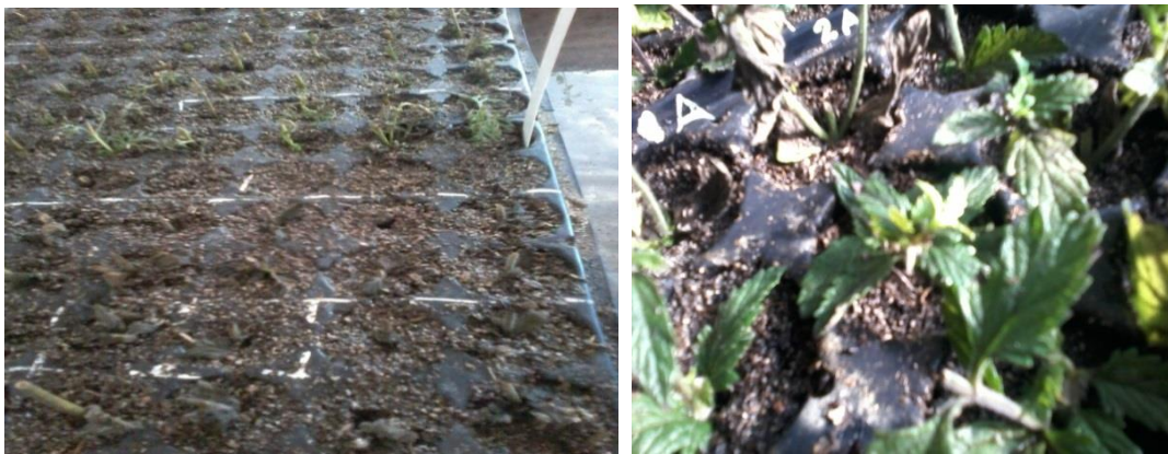
Figura 19. Bandeja con esquejes. Izquierda: detalle de bandeja con esquejes de Glandularia Alba INTA. Derecha: detalle de bandeja con esquejes de Glandularia Extrema Roja. Julio 2016