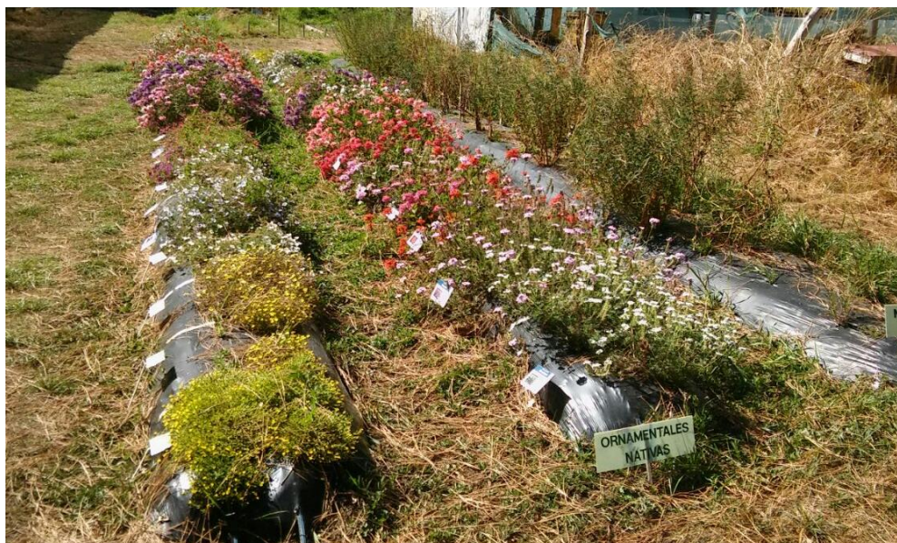
Figura 3. Genotipos de plantas ornamentales evaluadas en canteros de cultivo al aire libre en el INTA Bariloche, abril de 2016.

Para el trabajo se utilizaron plantas de genotipos obtenidos por el INTA, de los géneros Glandularia , Calibrachoa , Mecardonia y Nierembergia , que fueron cultivadas en suelo al aire libre en INTA Bariloche durante una temporada (primavera 2015 - invierno 2016) (Figura 3).