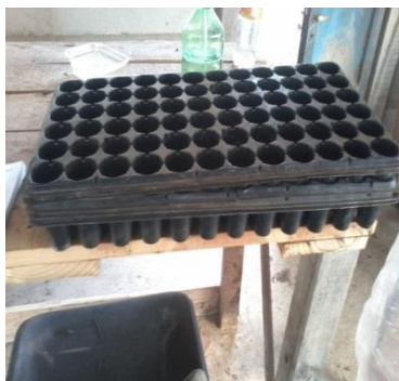
Figura 7. Bandejas multiceldas utilizadas para propagación por esquejes.

La etapa de acondicionamiento del material vegetal y preparación de las bandejas de cultivo, se realizó en un laboratorio de propagación con techo de chapa galvanizada, provisto con dos líneas de mesadas. El material se plantó en bandejas multiceldas (72 cavidades de 55 cm 3 ) (Figura 7), que se desinfectaron previamente por inmersión en agua y lavandina al 10%.