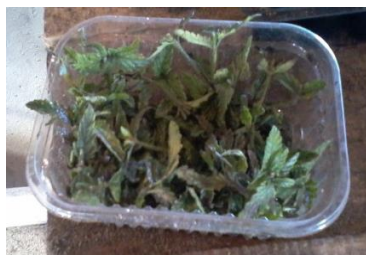
Figura 11. Esquejes de Glandularia . Izquierda: Detalle fracción del esqueje. Derecha: Bandeja con grupo de esquejes seleccionados, junio de 2016.