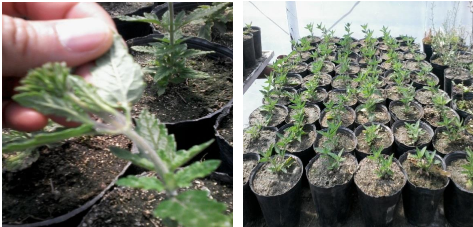
Figura 21. Izquierda: detalle de planta con botón floral y pulgón en el envés de la hoja. Derecha: macetas con plantas, octubre 2016.

Se observó la presencia de pulgones y arañuelas en el envés de las hojas, sin embargo las plantas se desarrollaron sin dificultad hasta octubre, en el invernadero donde se pudo observar la presencia de botones florales (Figura 21).