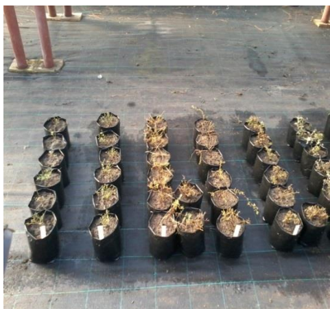
Figura 6. Ubicación de macetas sobre el suelo del invernadero del INTA Bariloche, junio 2016.