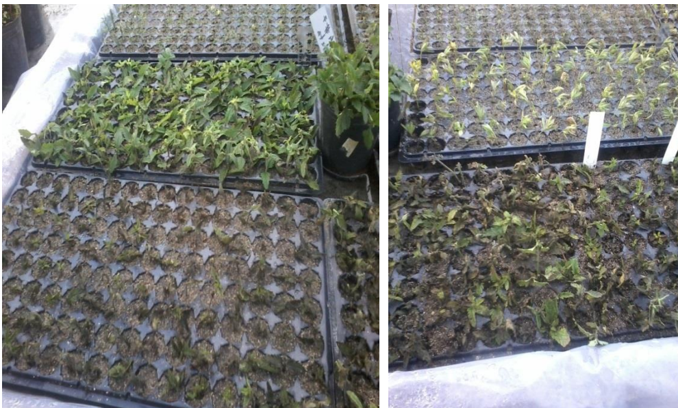
Figura 20. Bandejas con esquejes. Izquierda: detalle de esquejes en el invernáculo. Derecha: detalle de esquejes en el sector calefaccionado, julio 2016.