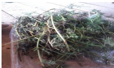
Figura 10. Esquejes del género Glandularia de plantas cultivadas al aire libre, junio de 2016.

Los esquejes, se cortaron con tijera de podar utilizando corte en bisel para el ápice y corte en recto para la base del esqueje (Figura 11). El material se acondicionó en bolsas plásticas rotuladas, se conservó en heladera y se fue sacando durante los días subsiguientes para establecer las pruebas de propagación.