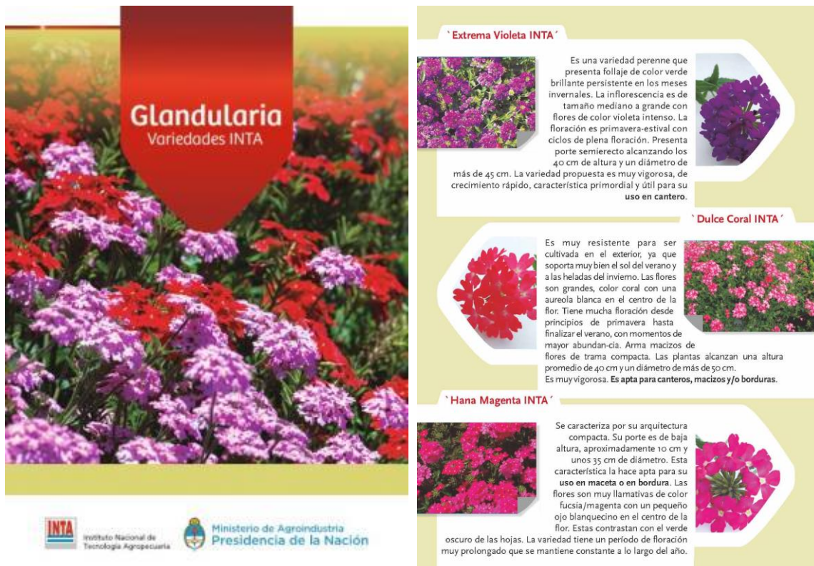
Figura 22. Manual de cultivo de las variedades INTA del género Glandularia (Bologna, 2018). Izquierda: Tapa del manual. Derecha: hoja 2 del manual con detalle las nuevas variedades registradas en 2016.

Previo al desarrollo de la práctica, el INTA había iniciado los trámites de registro del genotipo Glandularia “13224#7” ante el INASE. En octubre de 2016 se finalizaron dichos trámites registrando a este genotipo como variedad “ Extrema Violeta INTA ” (Figura 22).