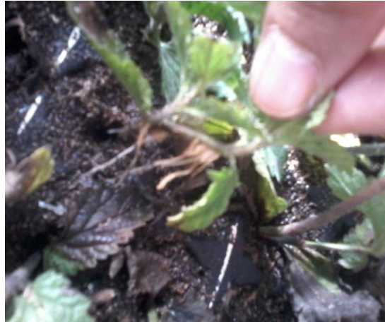
Figura 18. Detalle de esqueje de la variedad Glandularia Roja, en plugs en el sector calefaccionado. Julio 2016.