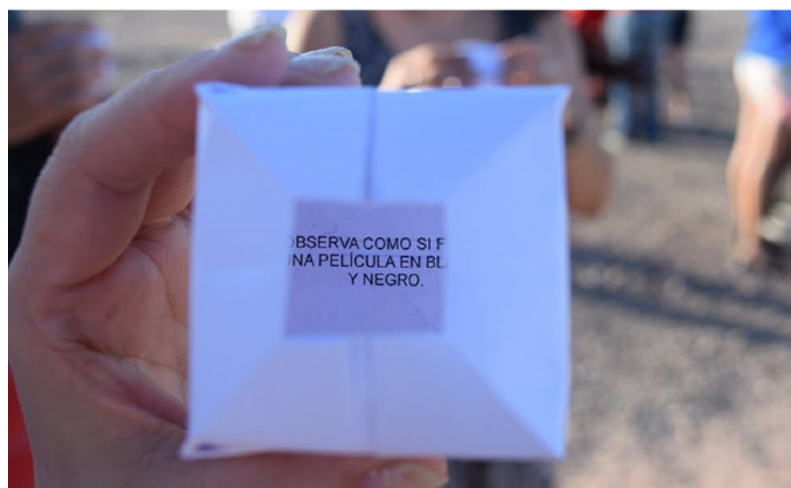
Imagen 4: Sacchi, J. (2015). Museo Meseta al cubo . Balsa Las Perlas, Río Negro, Argentina. Registro del artista.