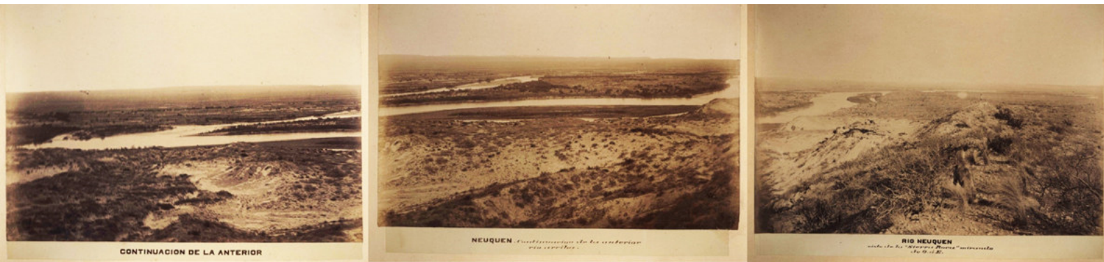
Imagen 8: Encina, Moreno y Cía (1883). Vistas fotográficas del Territorio Nacional del Limay y Neuquén. Tomo I [pp. 46- 48 (continuación de la anterior)]. Río Negro, Argentina.

las fotografías consideradas, deudoras de los modelos pictóricos de la vista y el panorama, realizan la operación de inventar espacios caracterizados por su gran tamaño y por su carácter natural, esto último enfatizado también por el contraste respecto de lo humano (p. 76).