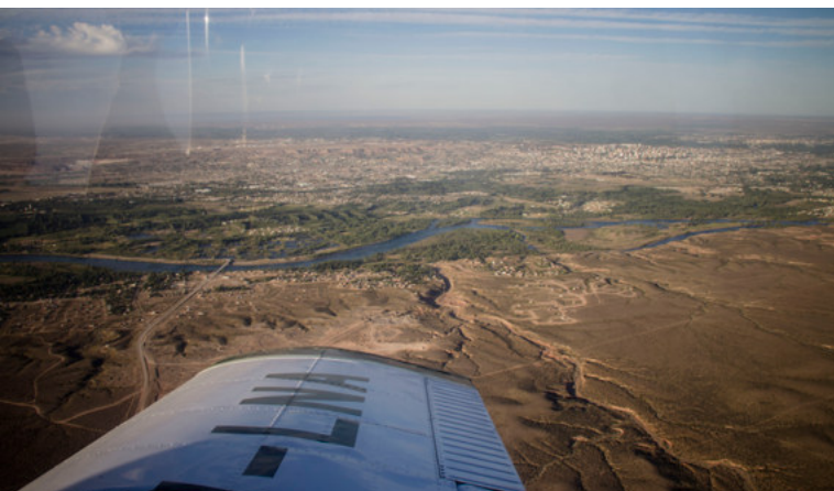
Imagen 3: Sacchi, J. (2015). Museo Meseta al cubo . Balsa Las Perlas, Río Negro, Argentina. Registro de la artista.

cubismo por medio de esta operación de diversificación de las miradas 2 .