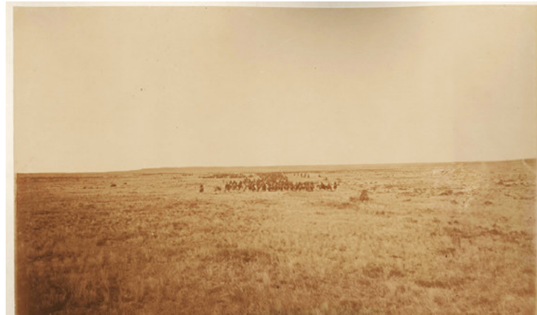
Imagen 7: Pozzo, A. (1879, abril-junio). Expedición al Río Negro [p. 48]. Río Negro, Argentina. El ejército marchando en columna.

Como señala Tell (2017), estos dos corpus se diferencian porque el primero –realizado en la