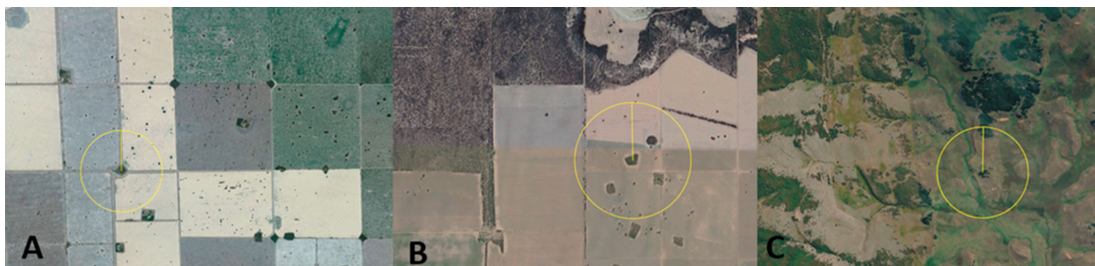
Figura 3. Ejemplo de parches aislados y conectividad dentro de una matriz de bosque en el paisaje. A) Parches aislados (0.9 ha) en una matriz agropecuaria sin conectividad con el bosque nativo (Tostado, Santa Fe). B) Parches aislados (0.5 ha) en una matriz agropecuaria y de bosque nativo sin conectividad (Fraga, San Luis). C) Parches aislados (0.5 ha) con conectividad de la matriz de bosque nativo (Río Turbio, Santa Cruz). Los círculos son de 500 m de radio.

La ecología del paisaje puso en evidencia la necesidad de una visión integradora de los múltiples procesos involucrados en los bosques nativos, ya que el entorno actúa a diferentes escalas espaciales y temporales (Peri et al. 2021a,b). Por ejemplo, es diferente el valor de un parche aislado en una matriz agrícola que en un paisaje donde predomina el bosque nativo (Figura 3). El principal factor es la conectividad, que junto al grado de exposición (tamaño y forma) y la distancia