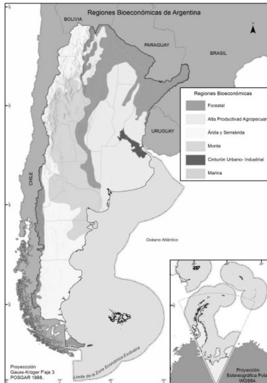
Figura 1. Mapa Biorregiones de Argentina

Nota: Extraído de Lengyel y Zanazzi (2020)