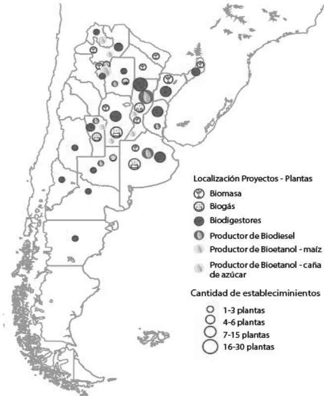
Figura 2. Localización de proyectos/plantas asociados al aprovechamiento de recursos biológicos.