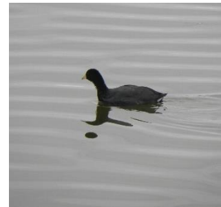
Cisne ( Coscoroba coscoroba ) / Flamenco ( Phoenicopterus chilensis ) / Gallareta (( Fulica teucoptera ))