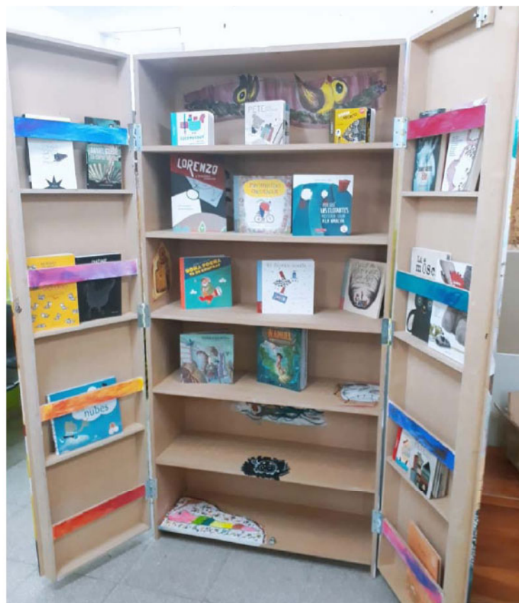
Figura 2. 3. Una biblioteca de puertas abiertas

En cuanto a las intervenciones de promoción lectora, se organizaron en dos etapas: por una parte, el acondicionamiento de ambientes de lectura en los espacios de espera, que permitieran el desarrollo de las actividades del equipo, pero además permanecieran disponibles para uso autónomo de los niños y las niñas asistentes durante el resto del tiempo. Esta tarea involucró la adquisición y elaboración de objetos de ambientación y carteleras de difusión, la gestión de mobiliario (estanterías, bibliotecas), la provisión de objetos lúdicos y de expresión artística, la colocación y distribución de dichos objetos en función de los acuerdos establecidos y, primordialmente, la ampliación de la dotación a partir de la adquisición de libros (posibilitada mediante la financiación del PE). La selección de los materiales literarios se trabajó de manera colectiva dentro del equipo, y tomó en cuenta criterios como la polisemia del discurso literario, la ambigüedad, la complejidad en la relación entre palabra e imagen, la calidad estética y literaria.