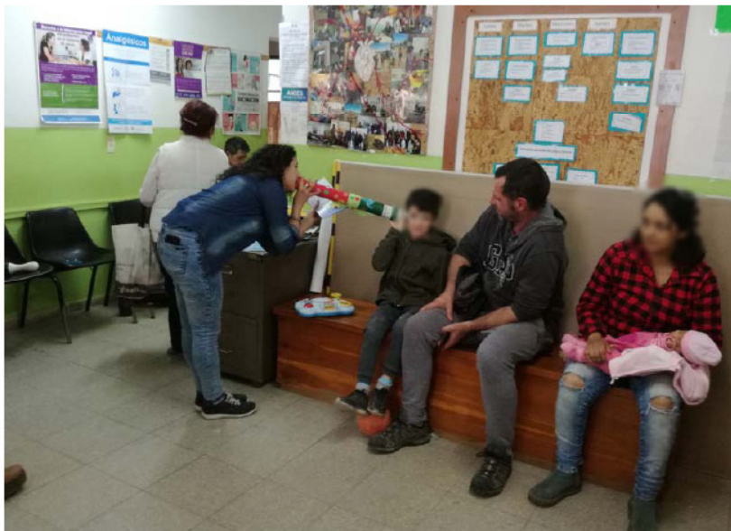
Figura 2. 4. Susurros poéticos

Por otra parte, la segunda etapa implicó el diseño y posterior realización de las intervenciones de lectura, para lo cual se conformaron equipos de trabajo para cada uno de los centros. Las instancias de planificación se enmarcaron en las reuniones de equipo ampliado de las que participaron docentes, estudiantes, bibliotecarias y colaboradores externos. En cuanto a la implementación, se asumieron variadas metodologías entre las que destacamos la disposición de libros en mantas o mesas para la exploración (individual, en parejas, en grupos pequeños), la lectura en voz alta, la narración oral, la lectura o narración con música en vivo, la dramatización, los susurros, el kamishibai japonés, teatro de papel, los pequeños universos portátiles (PUPS). En esta instancia, resultó enriquecedora la conformación heterogénea de los equipos, que incluyó a estudiantes de las distintas carreras y a colaboradores externos con diferentes trayectorias, lo que permitió complementar fortalezas de abordajes interdisciplinarios y diferentes modalidades de resolución.