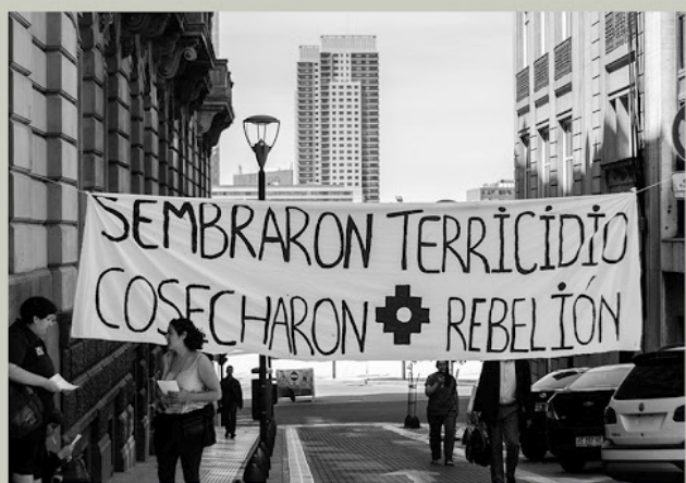
Movimiento de Mujeres Indígenas por el Buen Vivir. Fuerza y sabiduría ancestral.

dimensiones relacionadas a la perspectiva territorial, espiritual y cultural de las integrantes de este movimiento, en su doble condición de desigualdad: ser mujeres y ser indígenas. Desde el Movimiento plantean que no puede haber una lucha antipatriarcal si no hay una lucha anticolonial y antirracista, y hablan de la posibilidad de liberarse restaurando los pensamientos ancestrales, que plantean la reciprocidad y la armonía con los territorios y entre los pueblos.