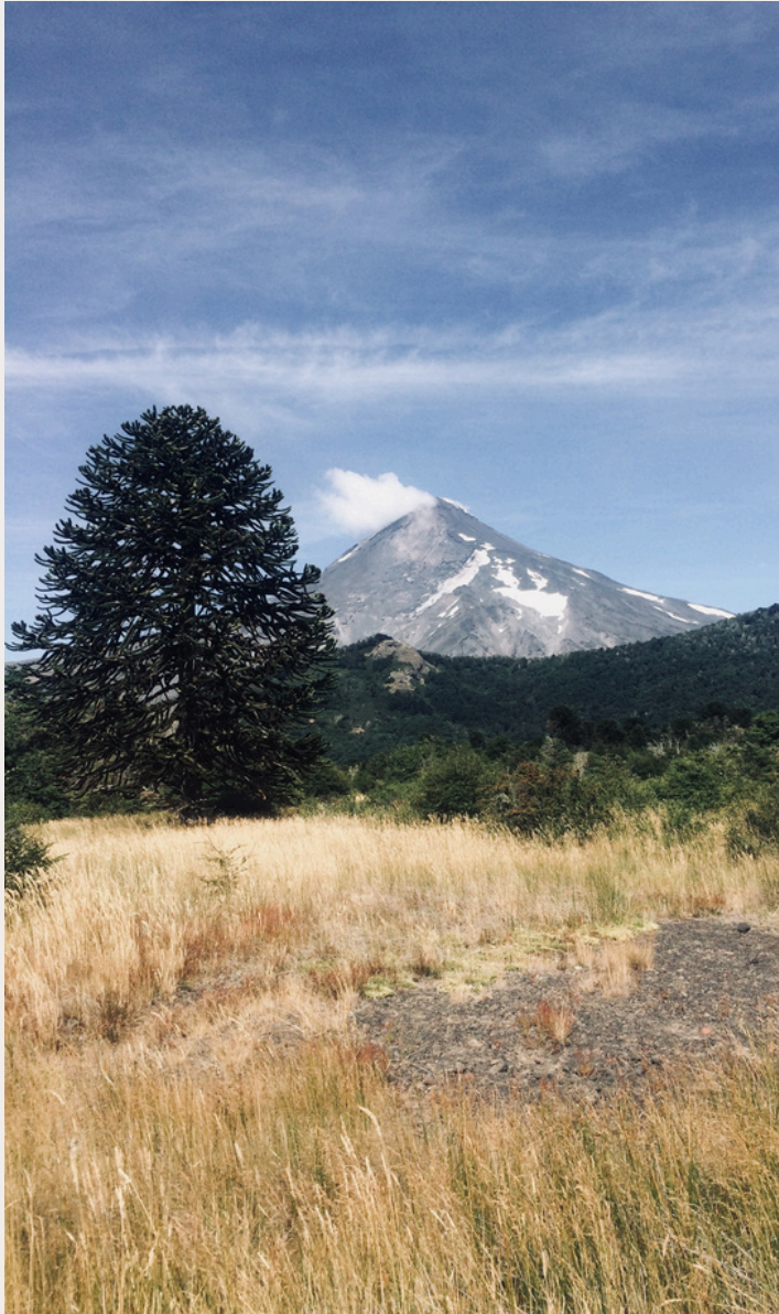
MALLEO (CARA NORTE) | 2018