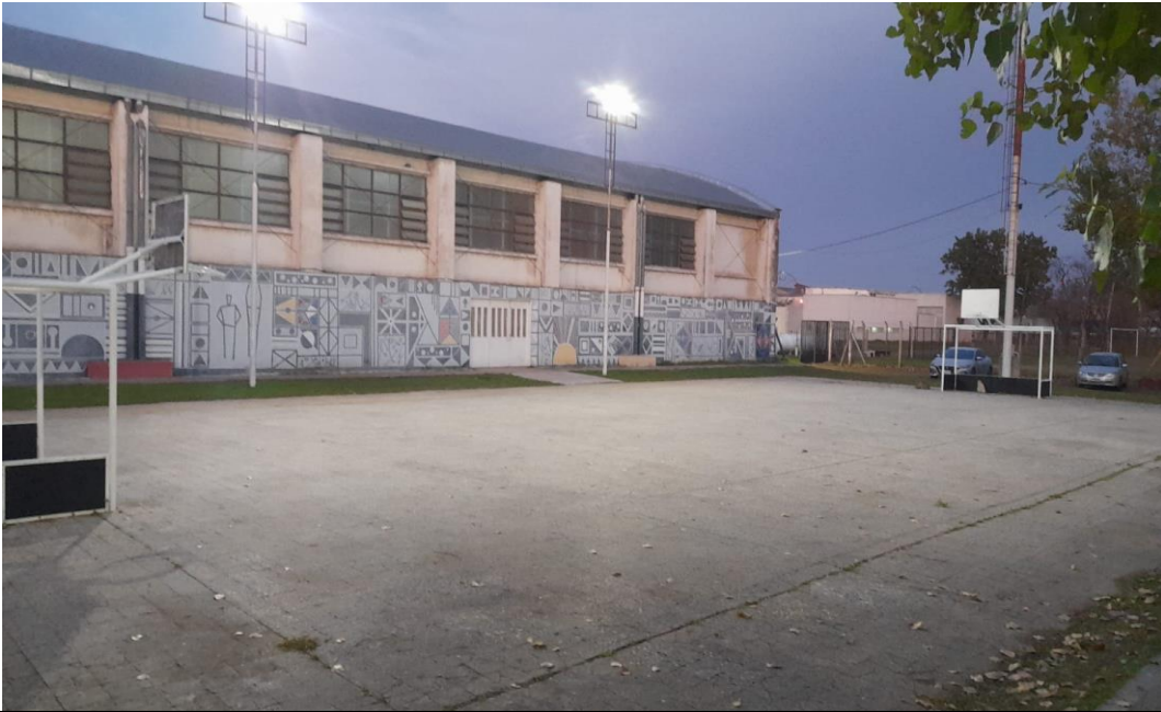
Cancha al aire libre para realizar hockey – handball - basquet