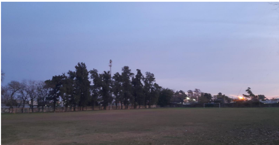
Cancha de futbol