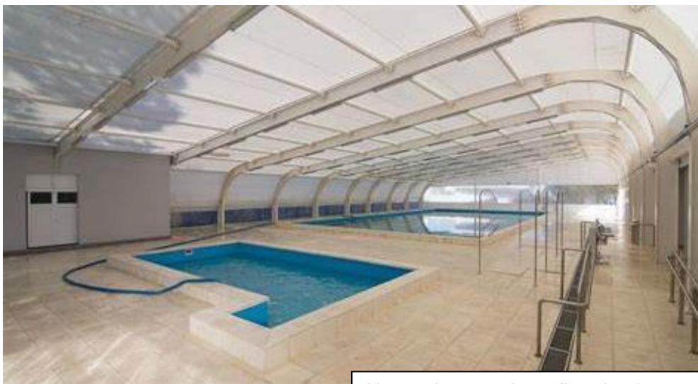
Natatorio cerrado y climatizado

Es un ámbito de aprendizajes y enseñanzas de prácticas deportivas, actividades físicas, entrenamiento y recreación, que están impulsadas y administradas por el Ministerio de Desarrollo Social a través de la Secretaria de Deportes y el Ministerio de Cultura de la provincia de Santa Fe.