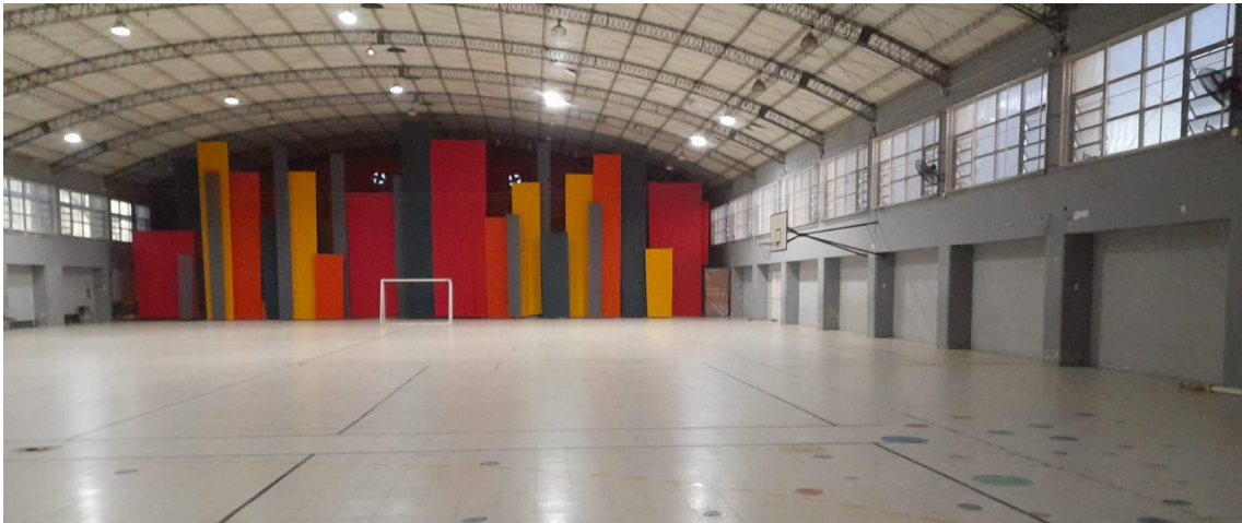
Salón cerrado, con aros de básquet y arcos de futbol - handball