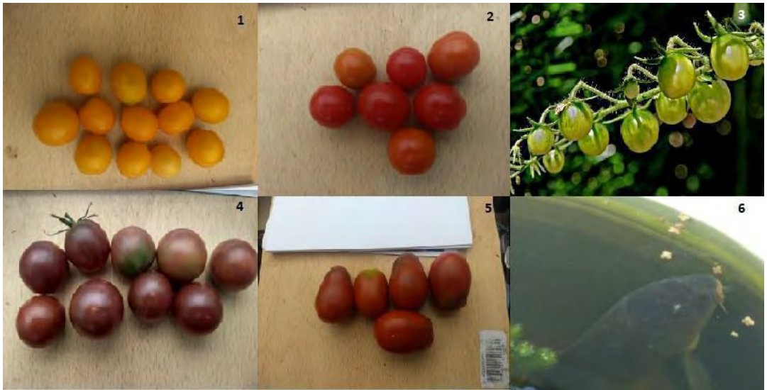
Figura 1. Especies utilizadas en el sistema acuapónico. 1-cherry amarillo; 2-brasil; 3-green; 4-chocolate; 5-kumato y 6- carpa Cyprinus carpio .

El modelo hidropónico utilizado para el sistema fue el de balsa flotante con sustrato inerte (puzolana). Los plantines utilizados fueron separados cada 25 cm y colocados en un recipiente que contenía 120 cm 3 de piedra puzolana. Los plantines correspondieron a cinco variedades de tomate cherry Solanum lycopersicum : amarillo, brasil, green, chocolate y kumato (Figura 1, "1 al 5"). Por cada variedad se sembraron 5 plantines con un tamaño aproximado entre 13 y 14 cm y con 3 hojas verdaderas de tamaño entre 4 y 6 mm de diámetro.