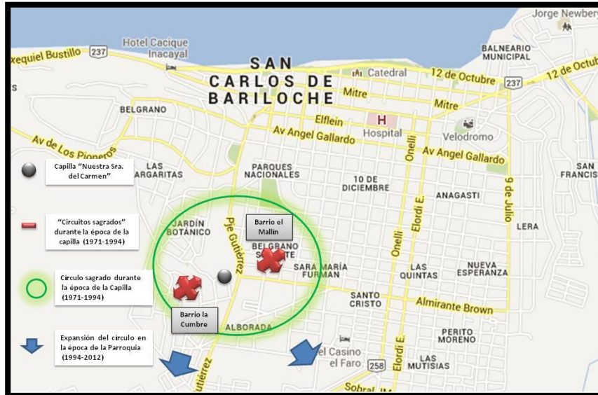
Mapa 2: Círculo Sagrado de la Capilla/Parroquia de Nuestra Señora del Carmen.

Nosotros hacíamos la fiesta de los chilenos el 18 de septiembre [...] se hacía una procesión desde Gutiérrez 82 con banderas y pancartas [...] 83 .