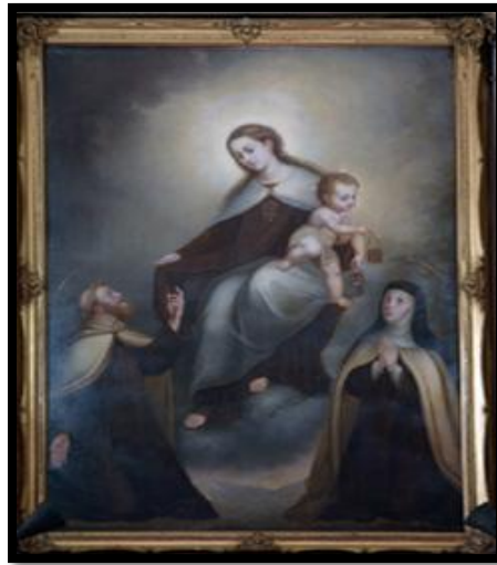
Figura 1: La Virgen del Monte Carmelo