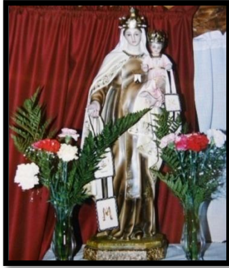
Figura 6: La Virgen del Carmen coronada de la época de la Capilla.