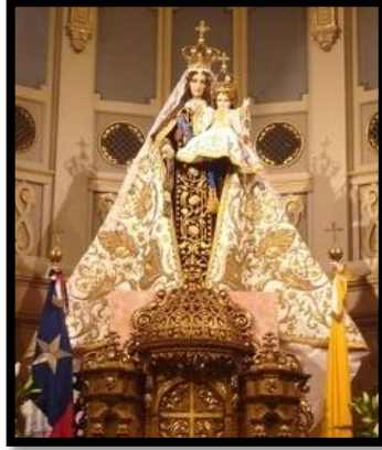
Figura 3: La Virgen del Carmen Madre, Reina y Patrona de Chile