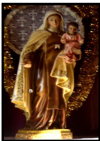
Figura 4: La Virgen del Carmen , entronizada en la Capilla (1972)

Fuente: Parroquia Nuestra Señora del Carmen.