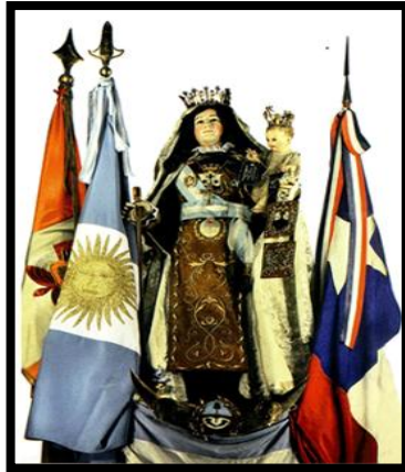
Figura 2: La Virgen del Carmen. Patrona de los Ejércitos de los Andes.