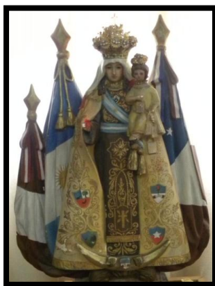
Figura 5: La Virgen del Carmen . Patrona de los Ejércitos de los Andes.

El sentido de pertenencia también se reforzó a través de otra imagen de la misma advocación, La Virgen de la Independencia bajo el patronazgo del Ejército de los Andes (Figura 5). La misma era utilizada por los fieles en las procesiones y festejos del 18 de septiembre, día de la Independencia chilena.