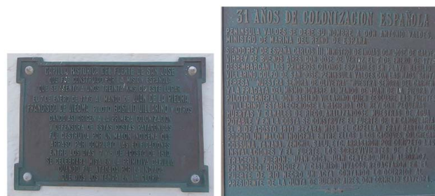
Figura 2. Placas conmemorativas en la réplica de la Capilla del Fuerte San José relativas (a) al malón que habría puesto fin al asentamiento y (b) al recuerdo de la gesta colonizadora.