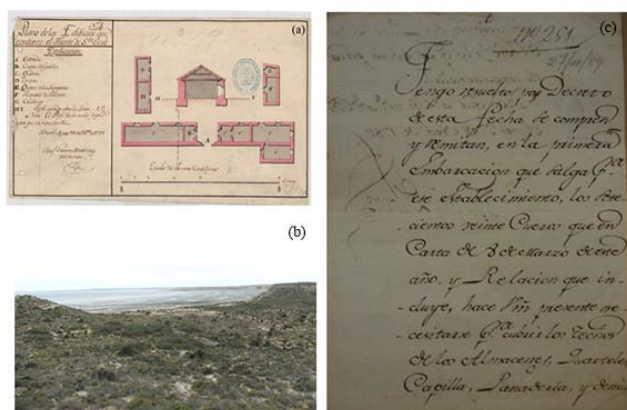
Figura 3. (a) Plano histórico correspondiente al Fuerte San José de Montevideo, Uruguay (Ministerio de Defensa, Archivo General Militar de Madrid, Servicio Histórico, ARG-4/7), (b) vista norte del sitio arqueológico del Fuerte San José, Península Valdés, Chubut y (c) documento histórico en el que describe la precariedad arquitectónica del Fuerte San José (Archivo General de la Nación, Sala IX, 16-4-6).

Figure 3.(a) Historical map of San José Fort, Montevideo, Uruguay (Ministerio de Defensa, Archivo General Militar de Madrid, Servicio Histórico, ARG-4/7), (b) northern view of San José Fort archaeological site, Península Valdés, Chubut and (c) historical document describing the architectural precariousness of San José Fort (Archivo General de la Nación, Sala IX, 16-4-6).