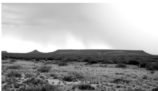
Figuras 1 y 2: Imágenes de las actividades y la geografía.

Ésta es una clave de la violencia que tratamos de explicitar, aquella enraizada en la imposibilidad de decidir sobre sí mismas por la falta de reconocimiento. Esta imposibilidad, paradójicamente, no se encuentra situada en las capacidades personales, sino en el reconocimiento oficial que se proyecta sobre las mujeres que nos ocupan, generada fundamentalmente desde el Estado y legitimada desde las agencias oficiales de producción de conocimiento y política pública. De esta manera, la violencia se constituye como el modo en que se asegura la reproducción social (Bourdieu, 2011) de un estilo particular de organización, en tanto mecanismo velado por las dinámicas de naturalización y el carácter fatalista que se apoyan en experiencias de extensos años de opresión (Martín-Baró, 1998). Desde los discursos centrales de concentración de poder, se opera performando actos de la construcción social de la realidad (social) como mecanismos legitimantes de un orden, en los que justamente grandes sectores o grandes po-