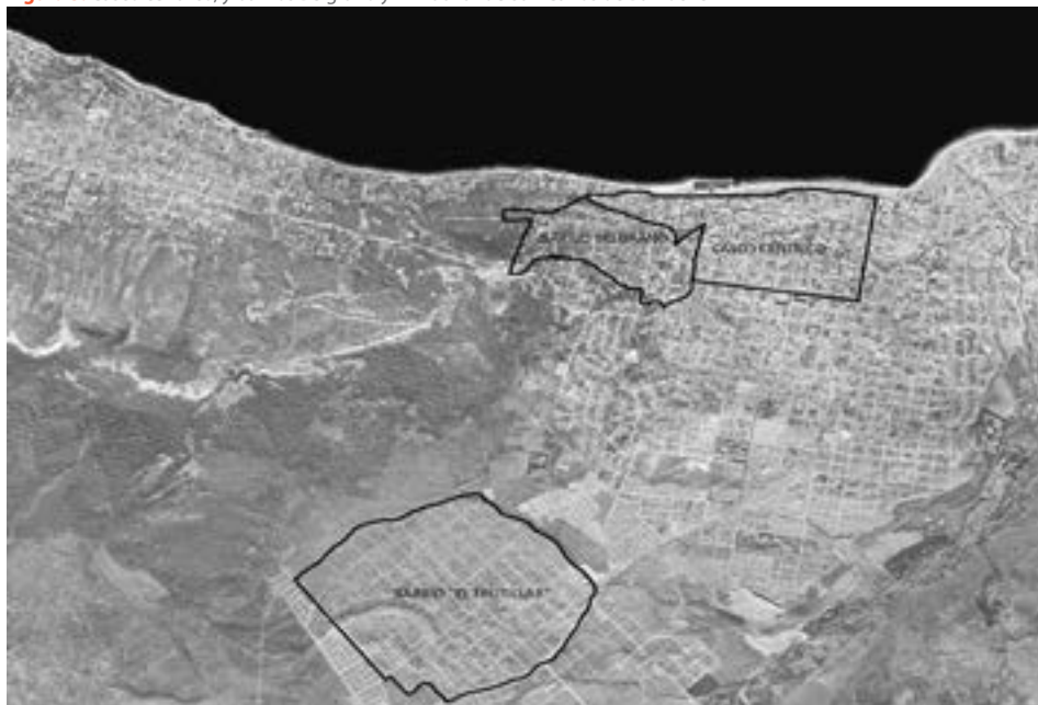
Figura 3. Casco céntrico, y barrios Belgrano y El Frutillar de San Carlos de Bariloche