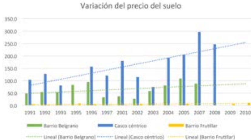
Figura 2. Precio promedio del suelo ofertado (US$/m 2 ) en tres áreas de San Carlos de Bariloche, 1991-2010

Fuente: elaboración personal a partir de los avisos clasificados en la revista local ABC.