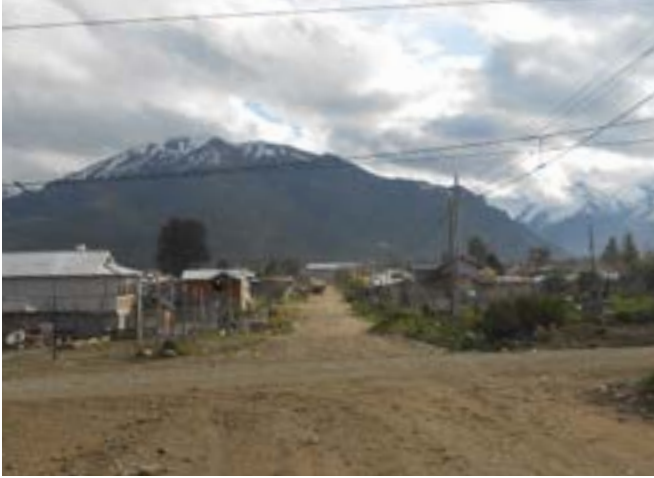
Figura 4. Barrio El Frutillar