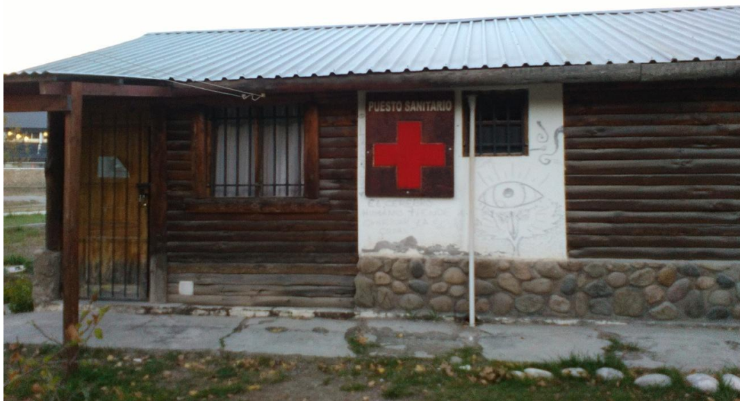
Puesto de Salud.