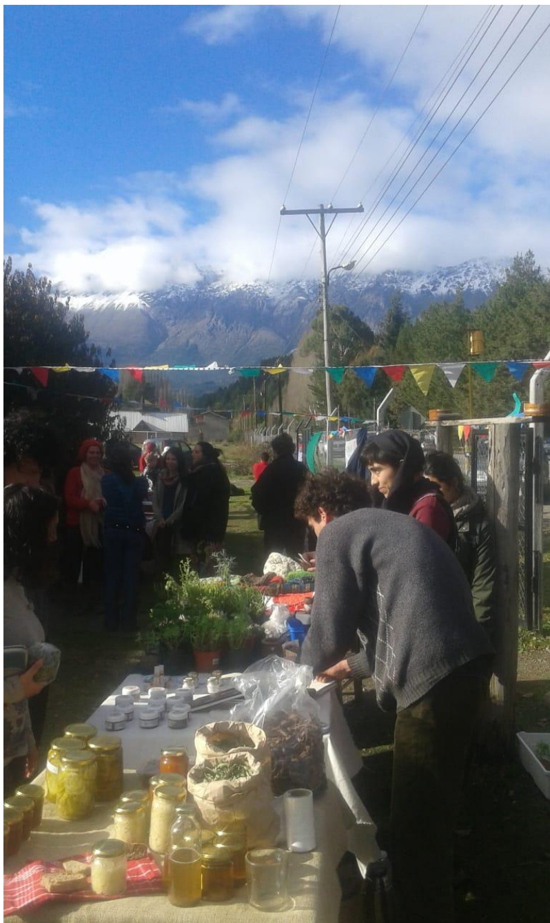
Primer encuentro de la nueva feria vecinal