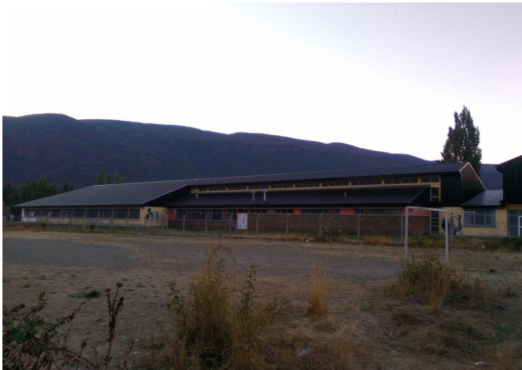
Escuela Secundaria N°788.