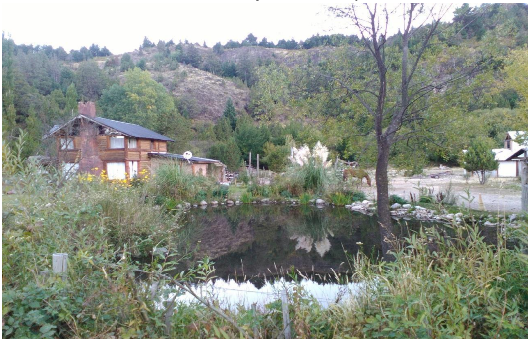
Complejo de cabañas. Unas de las decenas de cabañas instaladas en el paraje.