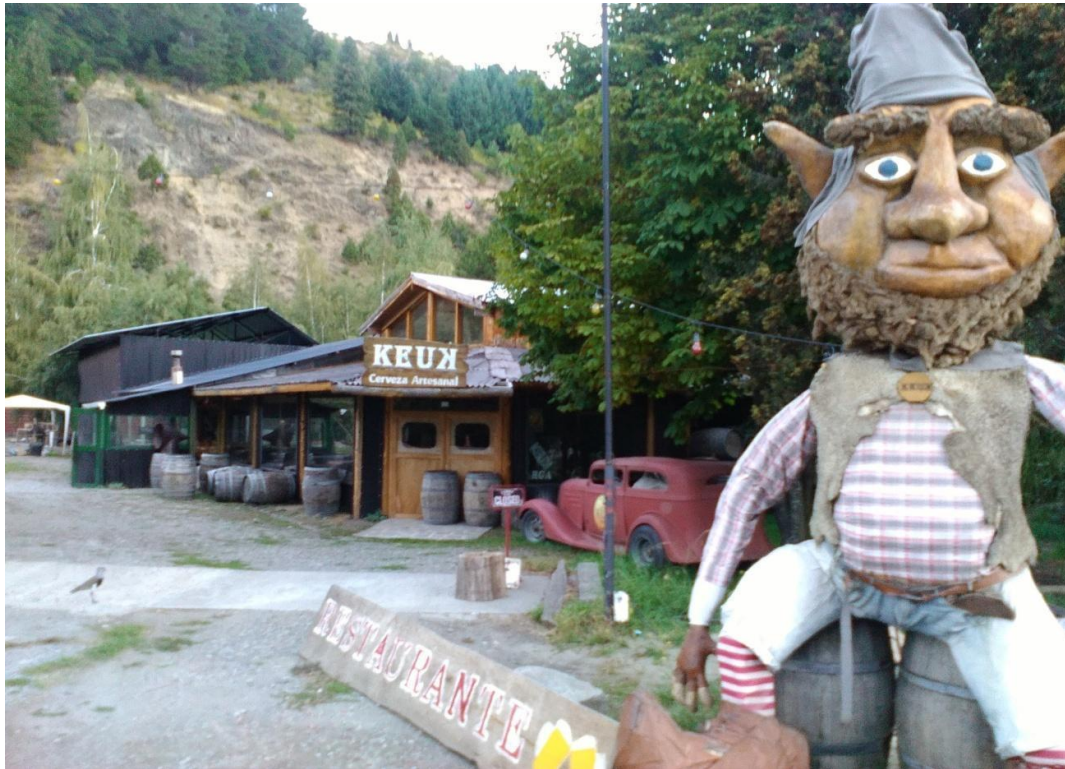
Cervecería Keuk, una de las dos cervecerías muestreadas.