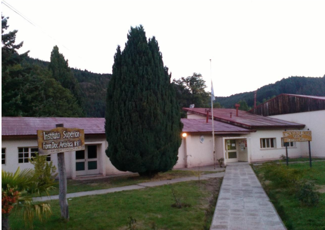
Escuela primaria N°109 y escuela de artes N°8.