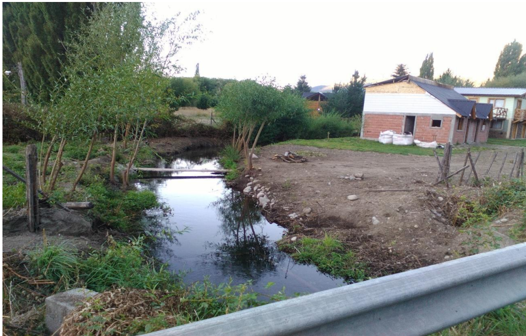
Canal de riego que recorre parte del paraje.