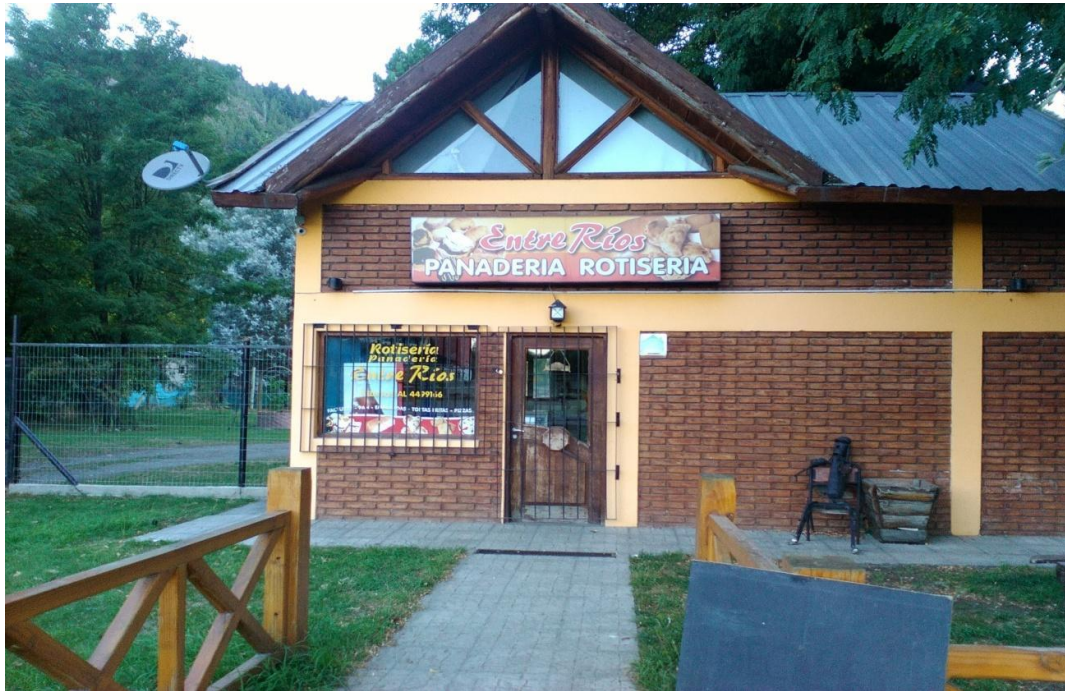
Panadería "Entre Ríos", uno de los negocios del Paraje.