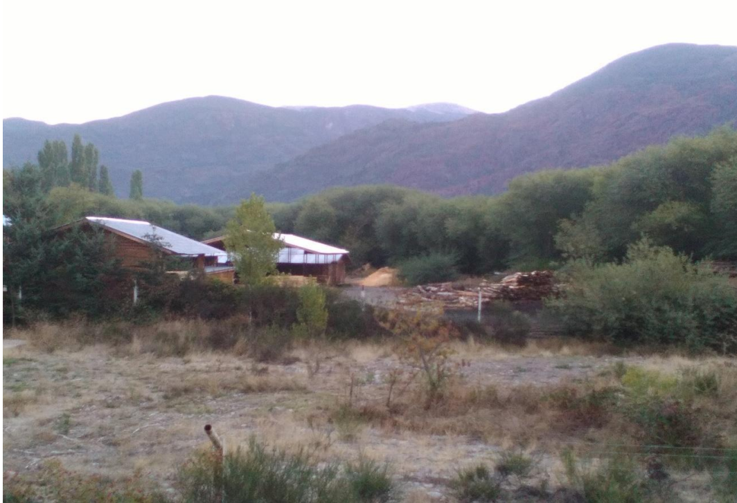
Maderera sobre el Rio Quenquentreu.