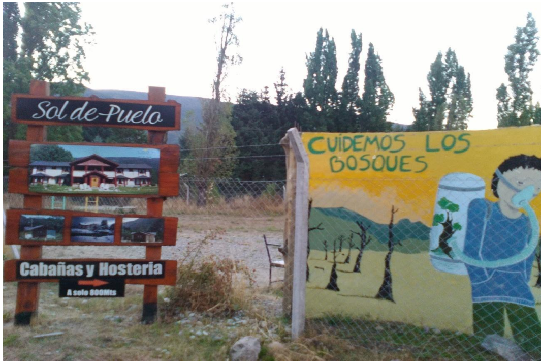
Carteles: intervención sobre concientización y publicitario para turistas.