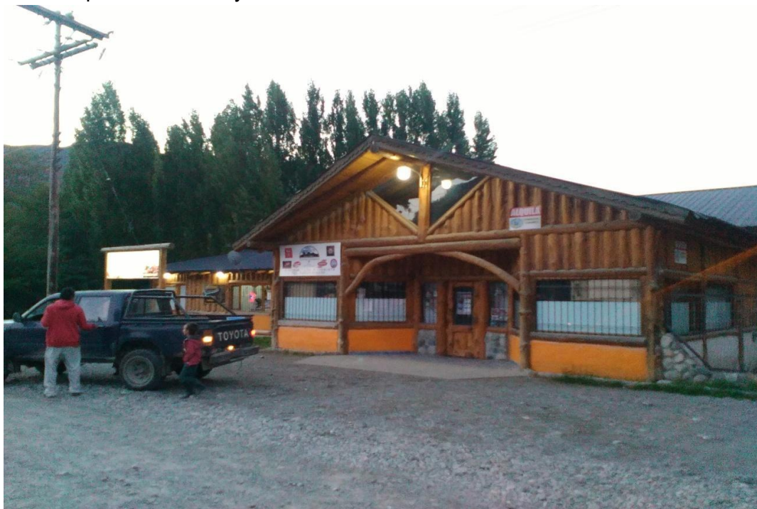
Mercado multirubro. Otro de los negocios en el paraje.