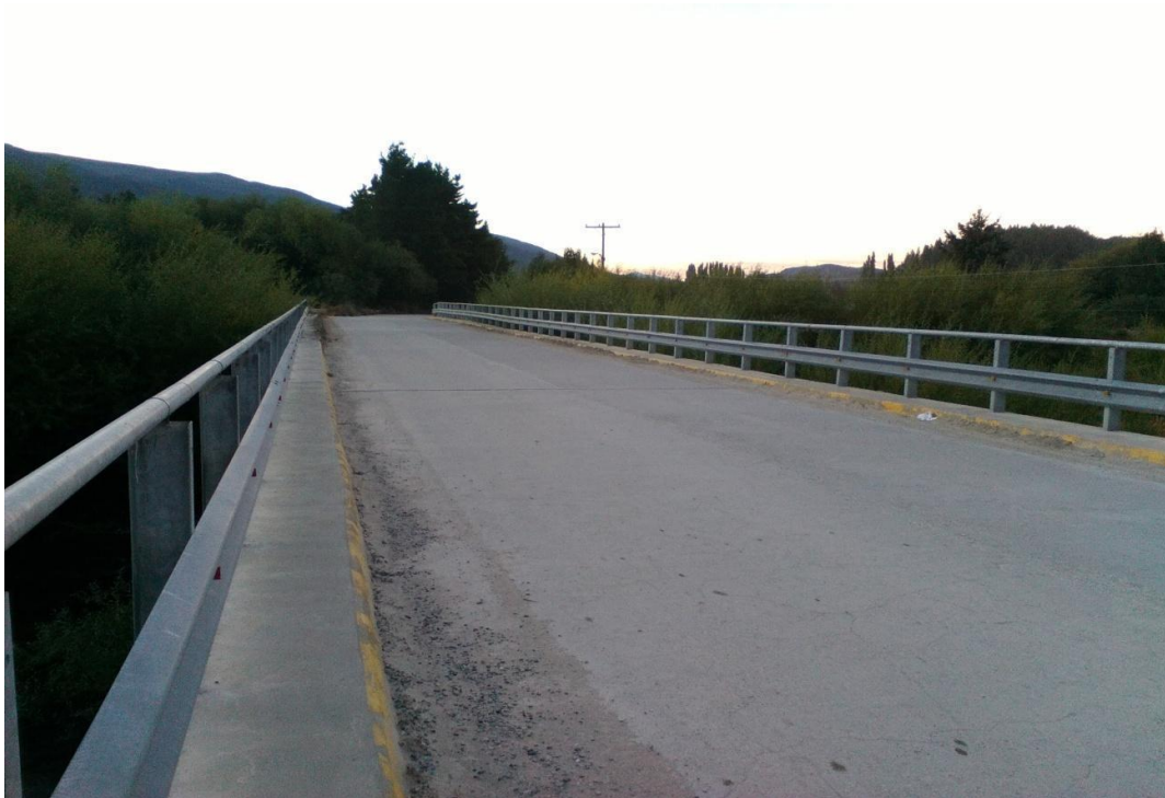
Puente sobre el Rio Quenquentreu que permite la conexión hasta el Río Azul.