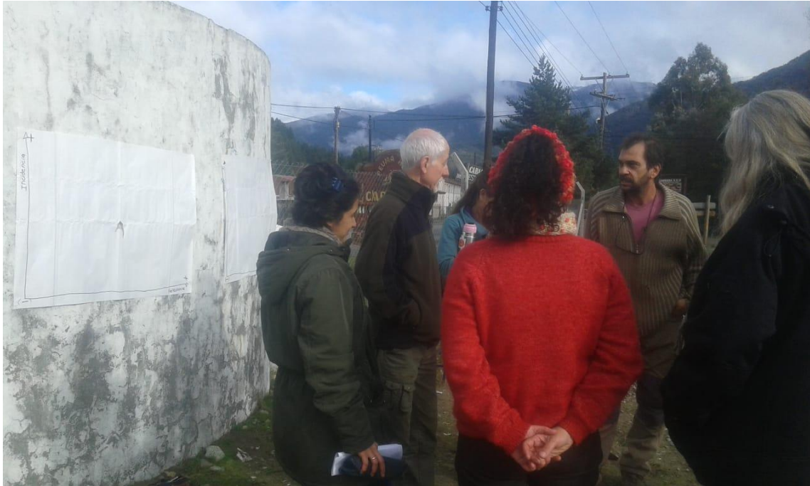
Participantes de la vecinal realizando el mapeo de actores y conflictos

Durante el desarrollo de este trabajo la vecinal ha pedido de manera explícita y en varias oportunidades el aporte de ideas y herramientas a los alumnos de la universidad que ayuden a la gestión y funcionamiento de la feria, tanto en la parte organizativa como en la implementación de un futuro SPG.