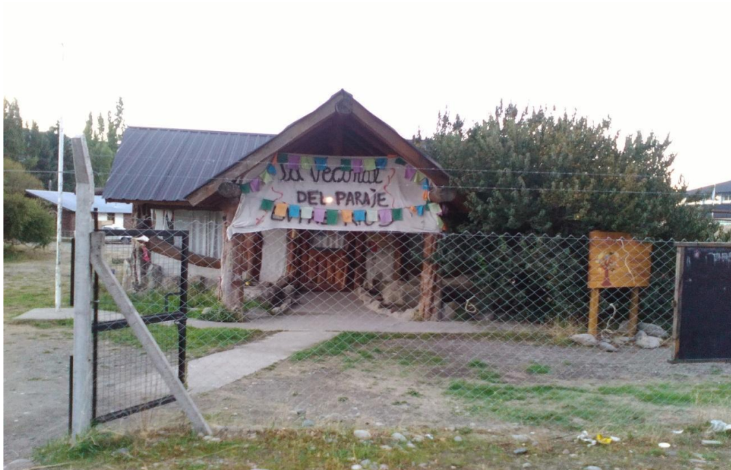
Vecinal del Paraje Entre Ríos.