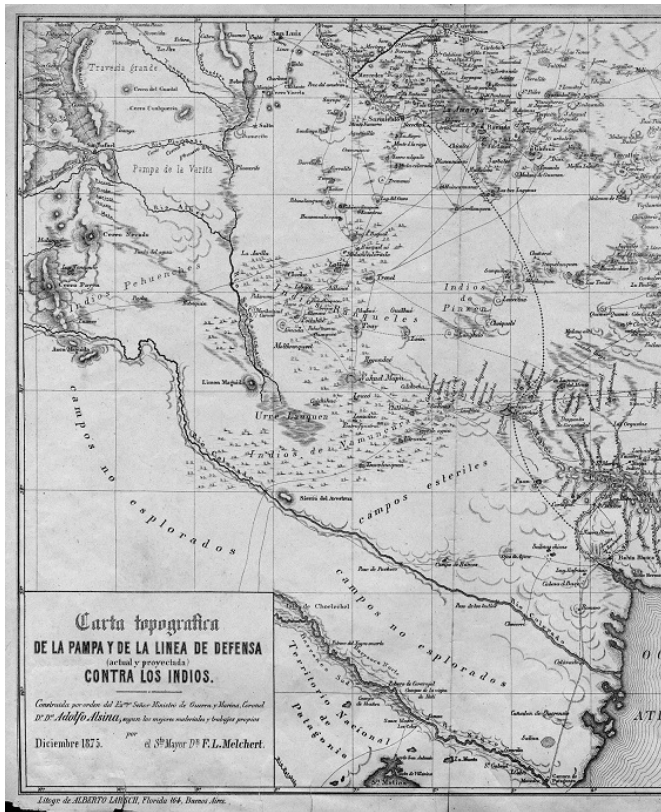
Figura 2. La Pampa y la línea de defensa contra los Indios. Mapa elaborado por F. L. Melchert

En la primera mitad del siglo XIX, los distintos gobiernos criollos asignaron a este espacio “un papel marginal, fronterizo, en la dialéctica del desarrollo de las fuerzas productivas del área central pampeana” (Navarro Floria, 1994: 17). Durante el proceso independentista a inicios del siglo XIX, para las Provincias Unidas del Río de la Plata, la Patagonia continuaba siendo denominado como un territorio bajo el dominio indígena (Figura 2 y Figura 3). En esa etapa las modificaciones jurisdiccionales eclesiásticas se produjeron en los territorios del norte con la creación de diócesis y obispados. La Patagonia siguió integrada a Buenos Aires sin reconocer poblamientos que demandaran otro tipo de jurisdicción (Figura 4).