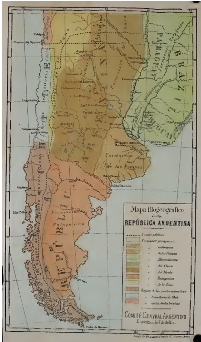
Figura 3. Mapa fitogeográfico de la República Argentina. Mapa elaborado por el Comité Central Argentino

Nota. Mapa elaborado a pedido del Estado Nacional para la Exposición de Filadelfia.