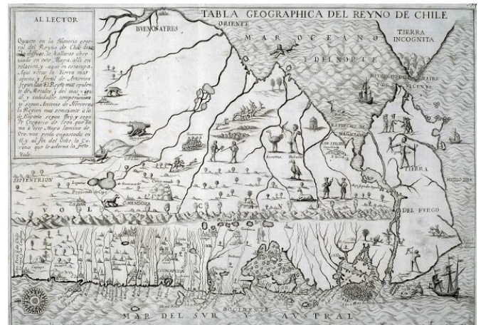
Figura 1. Tabula Geographica Regni Chile. Alonso de Ovalle, 1646