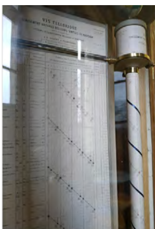
Béguyer de Chancourtois (1862)

En el caso de la tabla periódica, generalmente trabajamos con una sola representación, incluso cuando hasta el mismo Mendeleiev intentó diferentes tablas para simbolizar la ley periódica (Bensaude-Vincent, 2001). Dentro de los recursos disponibles en internet que pueden ayudarnos a revisar estas prácticas está una base de datos de tablas periódicas ( https://www.meta-synthesis.com/webbook/35_pt/pt_database.php?PT_id=9 ). Existen otros sitios de Internet en los que se puede acceder a diferentes representaciones de la tabla periódica, pero esta base de datos si no es la más completa, pareciera serlo. Podemos encontrar en ella además de nueve versiones de tablas periódicas publicadas por Mendeleiev entre 1868 y 1906, otras múltiples representaciones las cuales han sido clasificadas según el año en que se propusieron. Además se puede acceder fácilmente a propuestas circulares, en espiral y helicoidales, o en tres dimensiones (Figura 1). También se pueden encontrar tablas periódicas no químicas, de actores, de tipos de cervezas, chocolates, rock, entre otras (Figura 2). El único inconveniente que puede encontrarse con esta base de datos es que está en inglés, pero al tratarse de tablas periódicas y al poseer conocimiento sobre el tema la selección no será muy dificultosa.