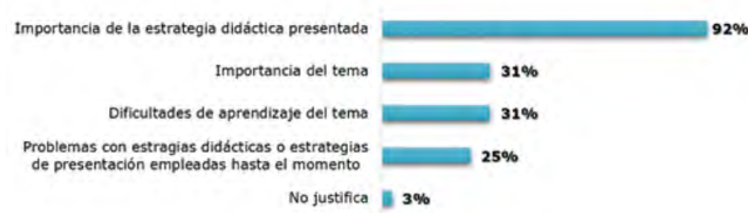
Figura 1. Fundamentación de la presentación de la innovación y/o investigación

Como se puede observar en la Figura I, las propuestas se fundamentaron principalmente (28 de 37 artículos) a partir de la importancia de la estrategia empleada. En más de la mitad de estos trabajos (17) la única fundamentación empleada estuvo ligada a las potencialidades de las estrategias, lo cual será descrito en el apartado siguiente.