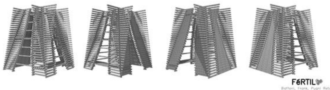
Figura 1: Imágenes finales del objeto-dispositivo Fértil (Producción propia).

La segunda premisa proyectual fue generar 3 tipologías de fachadas diferentes, pero que siempre se mantenga la lectura de la curva diagonal característica de la escalera cosechera. Mediante 3 transformaciones morfológicas, por adición, por sustracción y rotación radial . Se obtuvo, 1 cara de acceso -donde se aplica la sustracción-, a través de un VACÍO que COPIA la figura -curva diagonal-contorno de la escalera-, se sustrae la figura NEGATIVA que RECORTA la forma, según Wong 11 . Otra cara -donde se aplica la adición-, con un LLENO que COPIA/DELINEA la figura-contorno de la escalera, se adhiere la figura POSITIVA que sobresalen de la FORMA, según Wong 12 . Y la tercera, son 2 caras de ascenso, con la escalera cosechera neta-original-real. Estas 4 caras rotan radialmente cada 90° con respecto al eje central vertical, y en la cúspide tienen un punto de encuentro: el bin desmaterializado.