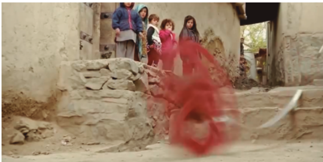
Francis Alÿs. Reel/Unreel . 2011.

El 12 de mayo de 2008, en la provincia de Sichuan, China, un terremoto de magnitud ocho sacudió el condado de Wenchuan y se convirtió en el segundo terremoto más devastador de la historia del país, que dejó un saldo de doscientos cincuenta mil muertos. Cinco años después de la tragedia, y como parte de la 55 Bienal de Arte de Venecia, Ai Weiwei presenta Straight , una instalación escultórica compuesta por ciento cincuenta toneladas de barras de acero que el artista recuperó de los colegios devastados tras el terremoto de Sichuan. Las varillas, cuyo diámetro varían, fueron obtenidas por Ai Weiwei en su estado original: deformadas por el peso, dobladas y torcidas; el artista hizo una relectura de los objetos y los enderezó para “recuperarlos”, en una acción metafórica por hacer las cosas bien.