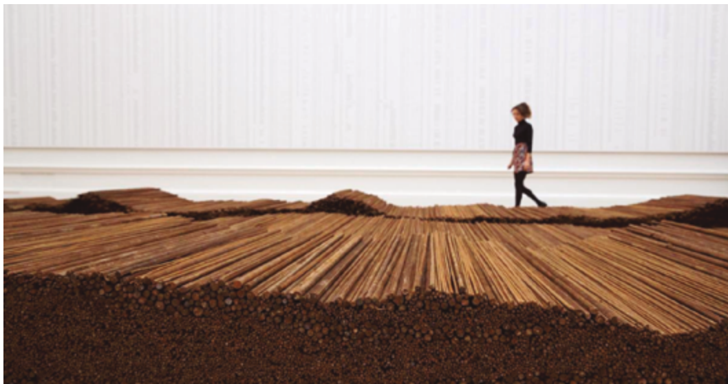
Weiwei, Ai. Straight . 2013.

El 12 de mayo de 2008, en la provincia de Sichuan, China, un terremoto de magnitud ocho sacudió el condado de Wenchuan y se convirtió en el segundo terremoto más devastador de la historia del país, que dejó un saldo de doscientos cincuenta mil muertos. Cinco años después de la tragedia, y como parte de la 55 Bienal de Arte de Venecia, Ai Weiwei presenta Straight , una instalación escultórica compuesta por ciento cincuenta toneladas de barras de acero que el artista recuperó de los colegios devastados tras el terremoto de Sichuan. Las varillas, cuyo diámetro varían, fueron obtenidas por Ai Weiwei en su estado original: deformadas por el peso, dobladas y torcidas; el artista hizo una relectura de los objetos y los enderezó para “recuperarlos”, en una acción metafórica por hacer las cosas bien.