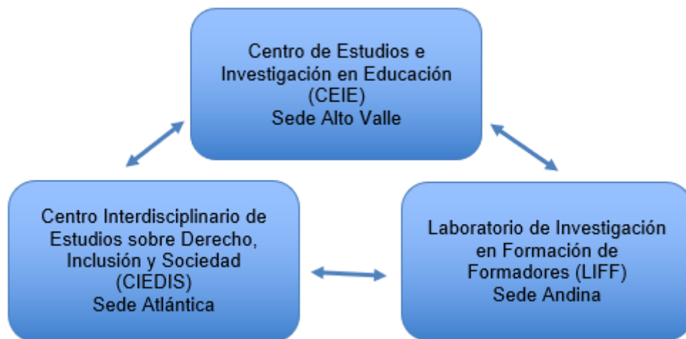
Esquema 1: Integración de investigadores de tres unidades ejecutoras de la UNRN para el desarrollo del proyecto de investigación. Elaborado por los autores.

La investigación toma como unidad de análisis a las trayectorias de formación de los profesores y profesoras que se matriculan en la Especialización en Docencia Universitaria en cada una de las tres Sedes de la Universidad Nacional de Río Negro: Sede Atlántica, localización Viedma; Sede Andina, localización Bariloche y Sede Alto Valle y Valle Medio, localización General Roca. También se determinarán las unidades de registro para el análisis de los datos, entendidas como las unidades de significación que se han de codificar para la construcción de las categorías. Para ello, las técnicas de recolección de datos serán diversas (se prevén realizar encuestas y entrevistas semiestructuradas y registro audiovisual de instancias de “focus group” con los integrantes de la muestra por perfiles). En el tratamiento estadístico de los datos, se recurrirá al uso de software específico como Insfotat. Para el desarrollo de las entrevistas a los/las estudiantes de la EDU se prevén viajes de trabajo de campo. La conformación de un equipo de investigación con integrantes pertenecientes a unidades ejecutoras de cada una de las Sedes de la UNRN, facilitará esta tarea. (Esquema 2).