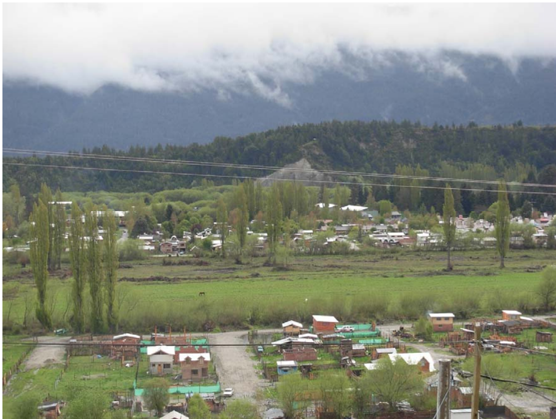
Imagen n°2: El Bolsón, 2016: la ciudad crece desordenadamente, coexistiendo con zonas de producción.

Dicha sociedad dual no sólo se manifiesta en la diversidad de actividades económicas coexistentes, sino también en la más importante que en este período es el turismo. Si bien la zona no tiene un perfil turístico marcado, atrae a familias, jóvenes y adultos mayores, generalmente de clase media. Se desarrolla el turismo de descanso, de aventura, ecoturismo, turismo mochilero y de compras artesanales en la Feria Regional Artesanal que expone el modelo paradigmático local de la autosuficiencia (Bondel, 2008:104-134).