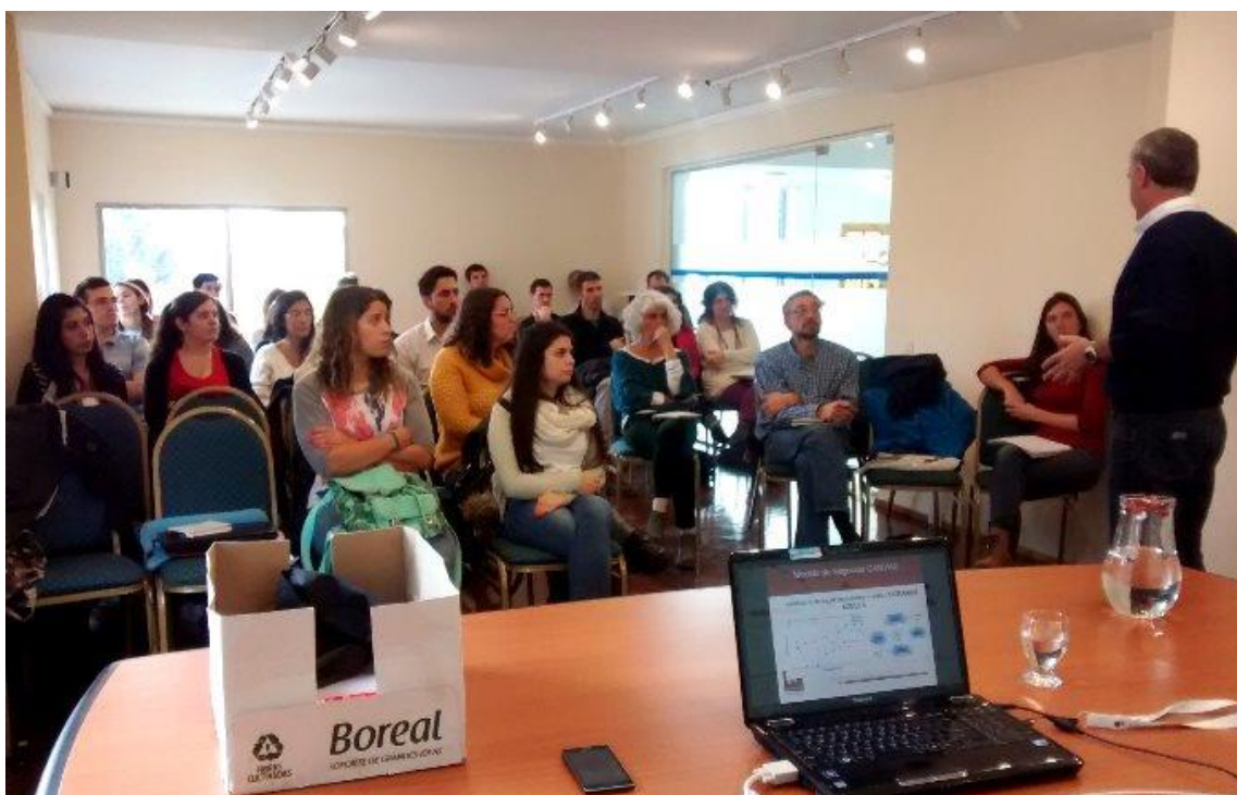
Ilustración 1 - Taller de CANVAS, en instalaciones de CONICET

Los estudiantes tuvieron a su cargo el apoyo y seguimiento de un proyecto emprendedor en particular, y acompañaron al empresario / emprendedor en las instancias de confección del modelo de negocios (CANVAS), Plan de Negocios y Tablero de Comando de Indicadores de Gestión. Participaron de actividades de capacitación y reflexión, llevaron adelante visitas al emprendimiento y asistieron al emprendedor en la redacción de los modelos descritos.