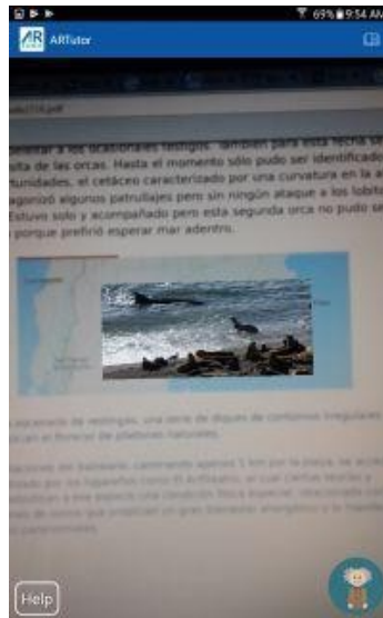
Fig. 2 - Visualización de contenido aumentado desde la app ARTutor2

Si el contenido aumentado es sonido, éste se reproduce en forma automática al detectar la imagen de activación, y en el borde superior izquierdo se podrá visualizar información del sonido activado. Cuando se hace ‘tap’ sobre el ícono ARTutor es posible interactuar con el sonido. En caso que la/s palabra/s o comando/s reconocido/s coincida/n con alguno de los assets que está activo, se producirá el aumento asociado. En cualquier otro caso, aparecerá un mensaje visual y en forma de audio que indica que el comando resulta desconocido. Esta funcionalidad permite interactuar con el contenido aumentado a través de comandos de voz o por gestos táctiles sobre la pantalla del dispositivo móvil.