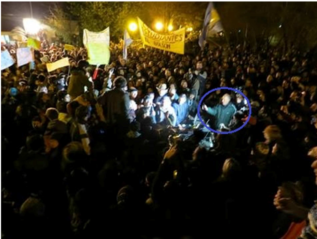
Figura N° 2. Manifestación del 25/5/13 (la foto muestra al intendente enmarcado en azul)