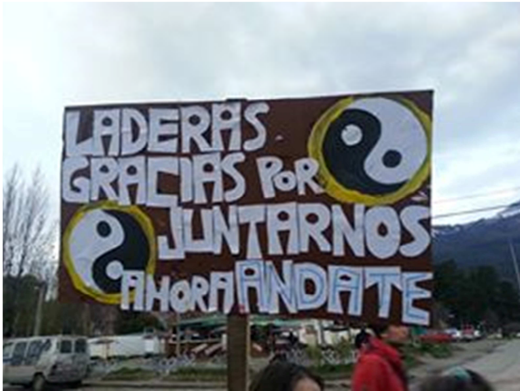
Figura N°3: Pancarta de la Manifestación del 29/5/13