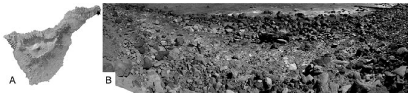
Fig. 1.- Mapa de localización e imagen de la plataforma del yacimiento de Igueste de San Andrés en la isla de Tenerife. Modificado de Martín-González et al. (2016). Ver figura en color en la web.

Entre los factores que producen la alteración del yacimiento (Fig. 2) señalamos la acción del oleaje, ya que, por su proximidad a la costa, parte del depósito queda sumergido en marea alta, y casi en su totalidad cuando existen mareas vivas o asociadas a tormentas. Además, el afloramiento es parcialmente sepultado por las rocas que aporta la acción del oleaje en algunas épocas del año, y por la erosión de los coluviones del talud en cuya base se sitúa el