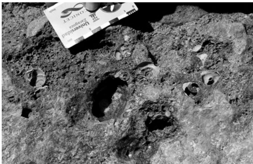
Fig. 2.- Detalle del efecto erosivo del mar sobre conchas de gasterópodos terrestres. Ver figura en color en la web.

En el yacimiento en estudio la acción del mar es la principal causa de deterioro y debido a que es imposible realizar medidas directas de protección sobre el yacimiento ante la erosión marina severa, se decidió