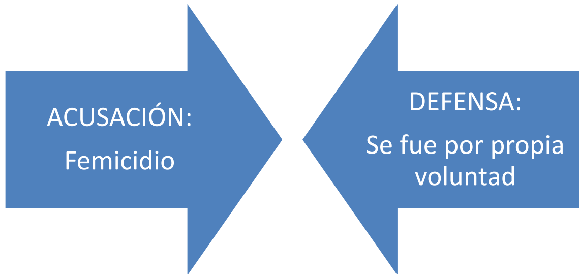
Figura nº 3: Teorías del Caso.

Vemos que de la teoría de la Acusación Marcos Thola Durán mató a su ex pareja Silvia Vasquez Colque, lo que configura un caso de femicidio, es decir “ el asesinato de personas del sexo femenino por personas del sexo masculino debido a su condición de ser personas del sexo femenino ” (Rusell, 2008:41).