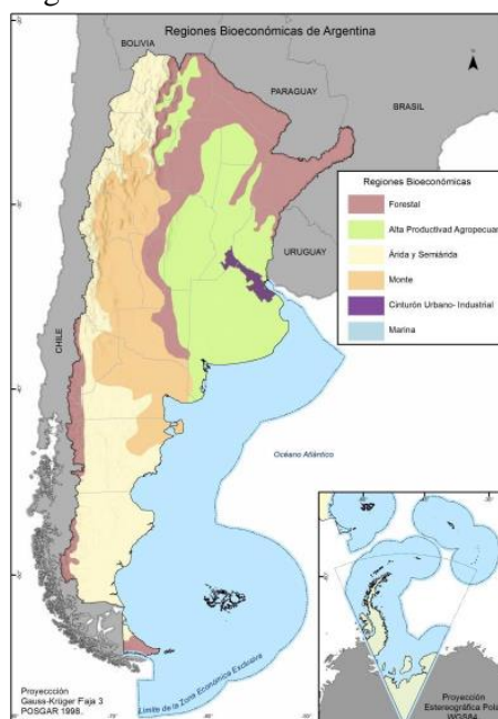
Figura 1. Mapa Biorregiones de Argentina.

El CIECTI propone la definición de biorreiones , como criterio para la intervención estratégica para el desarrollo de la Bioeconomía (ver Figura 1). Estas biorregiones se consideran como un ámbito territorial multidimensional cuyos factores son la oferta predominante de recursos biológicos, las capacidades de producción de conocimiento científico tecnológico y de innovación, y la infraestructura física e institucional de apoyo. En particular, el perfil bioeconómico de la biorregión forestal se asocia a la producción de biomasa forestal y su aprovechamiento, los cuales abarcan la industria de la madera tradicional, la industria química para producir papel, así como también la producción no maderera (producción de medicinas, cosméticos, alimentos, hongos, etc).