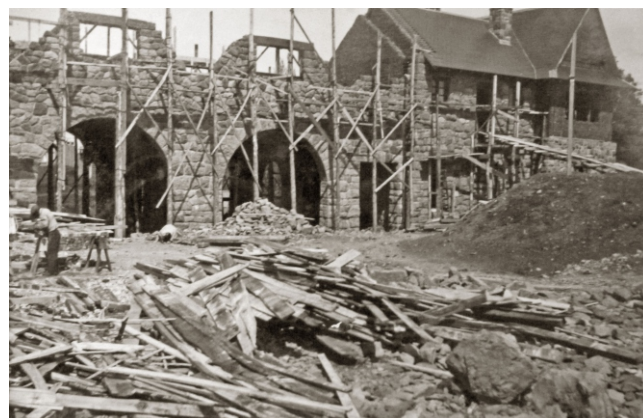
Figura 1: Construcción del edificio del Museo de la Patagonia, 1940

El Museo de la Patagonia "Francisco P. Moreno" fue creado como parte del complejo fundacional del Parque Nacional Nahuel Huapi en 1940. Fundado para la reafirmación de la soberanía argentina y la construcción de una identidad monolítica sustentada en la conquista del desierto (Figura 1). Para ese entonces el edificio, localizado en el Centro Cívico de la ciudad de Bariloche, estaba rodeado por otros pertenecientes a la misma dependencia. En el año 1987, el Complejo Edificio Centro Cívico fue declarado Monumento Histórico Nacional por el Consejo Internacional de Museos y Sitios (ICOMOS, 1987). De este modo el Museo quedó comprendido en esta declaratoria que le da un valor patrimonial que trasciende las fronteras y evidencia que la historia de vida de los monumentos patrimoniales es el producto de diferentes conceptualizaciones del mundo (Fernández Do Río y Murriello, 2018).