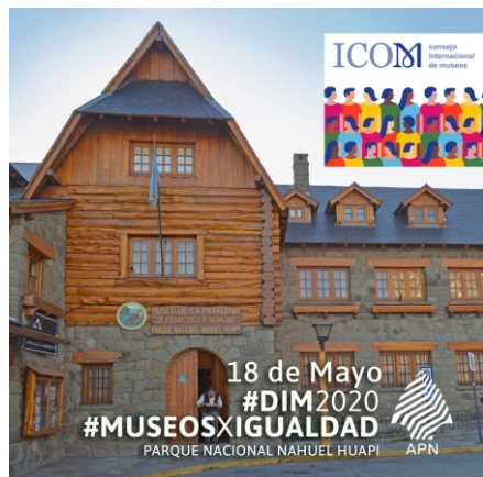
Figura 2: Conmemoración del Día Internacional de los Museos (ICOM), mayo 2020

El criterio de inclusión-exclusión trasciende las fronteras de la accesibilidad física, también es cultural. Los museos ofrecen múltiples barreras no sólo en términos de infraestructura y museografía inadecuada para distintos tipos de discapacidades sino de narrativas. Discursos hegemónicos, lenguajes técnicos y disciplinares, estéticas y propuestas museográficas perimidas son algunos de los obstáculos que justifican la ausencia de ciertos públicos. También las lógicas curatoriales centradas en una sola mirada lo son. El desafío de abrir al intercambio desde la concepción de las exposiciones es un camino, trabajoso claro, en búsqueda de una apropiación del museo por su comunidad (Murriello, 2016). La necesidad de una revisión general de la narrativa del Museo en función de este marco nos remitió a pensar ¿Qué Museo queremos? En este artículo se relata el proceso de autorreflexión y análisis crítico del quehacer institucional, así como el trabajo con el equipo y se comunican las ideas fuerza que están guiando la regeneración del Museo hacia la apertura de nuevas voces, la visibilización de otras historias y la generación de espacios en pos de una mayor inclusión de derechos y desafíos como sociedades del siglo XXI.