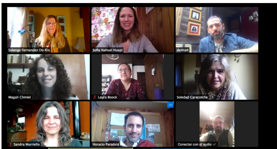
Figura 3: Reuniones virtuales del equipo de trabajo

En una segunda etapa, se trabajará con el rediseño del guion museográfico de la muestra permanente, a través de un proceso de consulta y participación de diversos sectores. De este modo, se convocará a referentes de organizaciones sociales y culturales y especialistas que permitan repensar los contenidos de las muestras a la luz de los nuevos desafíos identificados, y a los lineamientos estratégicos del Plan de Gestión del PNNH.