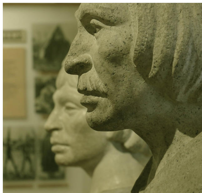
Figura 6: esculturas en sala de Historia regional, muestra permanente.

En síntesis, a partir de reflexionar cómo fué y es la interrelación entre la diversidad y las exhibiciones que tuvieron lugar en el Museo a lo largo del tiempo, los distintos temas son puestos en diálogo con los derechos que la ciudadanía fue adquiriendo hacia un espacio generador de mayor reconocimiento mutuo y diálogo intercultural.