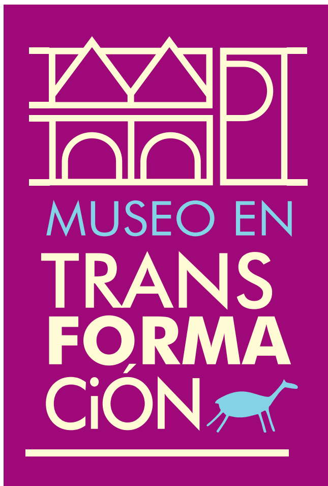
Figura 5: Diseño para la muestra "Museo en transformación".