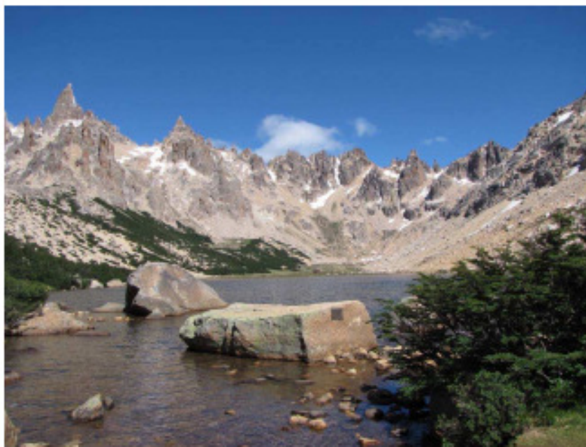
Figura 5. Vista de las Agujas Principal y Frey, y de la Laguna Tonček frente al Refugio Frey.