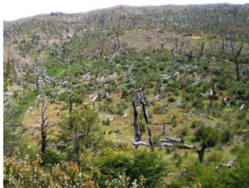
Figura 4. Bosque Quemado en la senda camino al Refugio Frey.