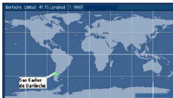
Figura 1. Ubicación en el globo del Parque y de Bariloche.