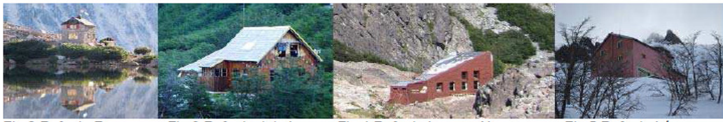
Figura 2. (a) Refugio Frey; (b) Refugio Jakob; (c) Refugio Laguna Negra; (d) Refugio López.

Cada refugio posee su propia carga inmaterial, ya que fueron construidos de acuerdo al siguiente detalle: Emilio Frey en el año 1957 sobre tierras del Parques Nacionales, al igual que el Jakob (Gral. San Martín) en el año 1952 y Laguna Negra en la temporada 1969/70; por el Club Andino Bariloche (CAB). El Refugio López se realizó en tierras del parque municipal.