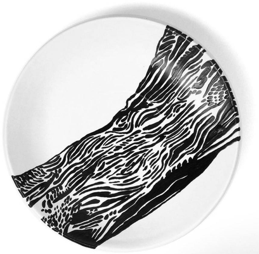
Imagen 5: Cabrera, G. (2018). Dispositivo para domar la intemperie . Río Negro, Argentina.

piña inglesa o las montañas de Gaspar Friedrich. Este paisaje es un territorio de disputa, marcado por una herida colonial aún presente en la ciudad de General Roca, antes Fiske Menuco. Es así que busco volver a representar un territorio domesticado estéticamente por la mirada occidental y reimaginarlo como un territorio precolonial: un ejercicio imposible.