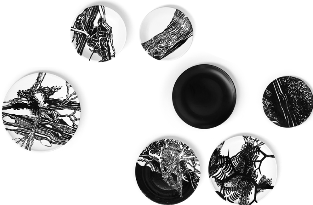
Imagen 1: Cabrera, G. (2018). Dispositivo para domar la intemperie . Río Negro, Argentina.