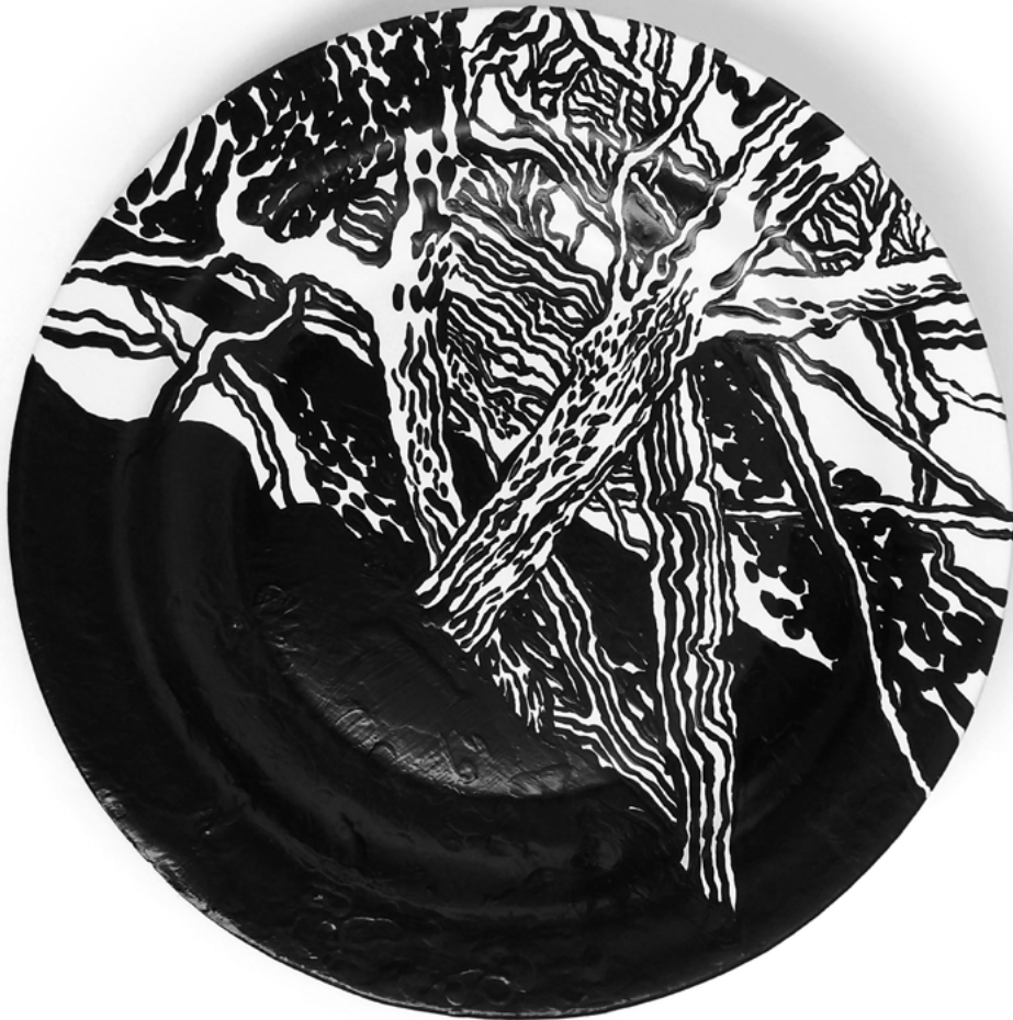
Imagen 3: Cabrera, G. (2018). Dispositivo para domar la intemperie . Río Negro, Argentina.

no se usa, sino que se exhibe. La función que originó su morfología permanece como vestigio de una práctica, pero ya no tiene más sentido en la pared. Sin embargo, algo de este origen utilitario permanece latente en su estatus. Se presenta así como un dispositivo minorizado, legítimo para la ornamentación de comedores burgueses, digno de una contemplación distraída. Un plato no representa batallas ni héroes, sino paisajes aliñados, ordenados por una mirada que lo construye, a lo sumo personajes pintorescos que lo habitan.