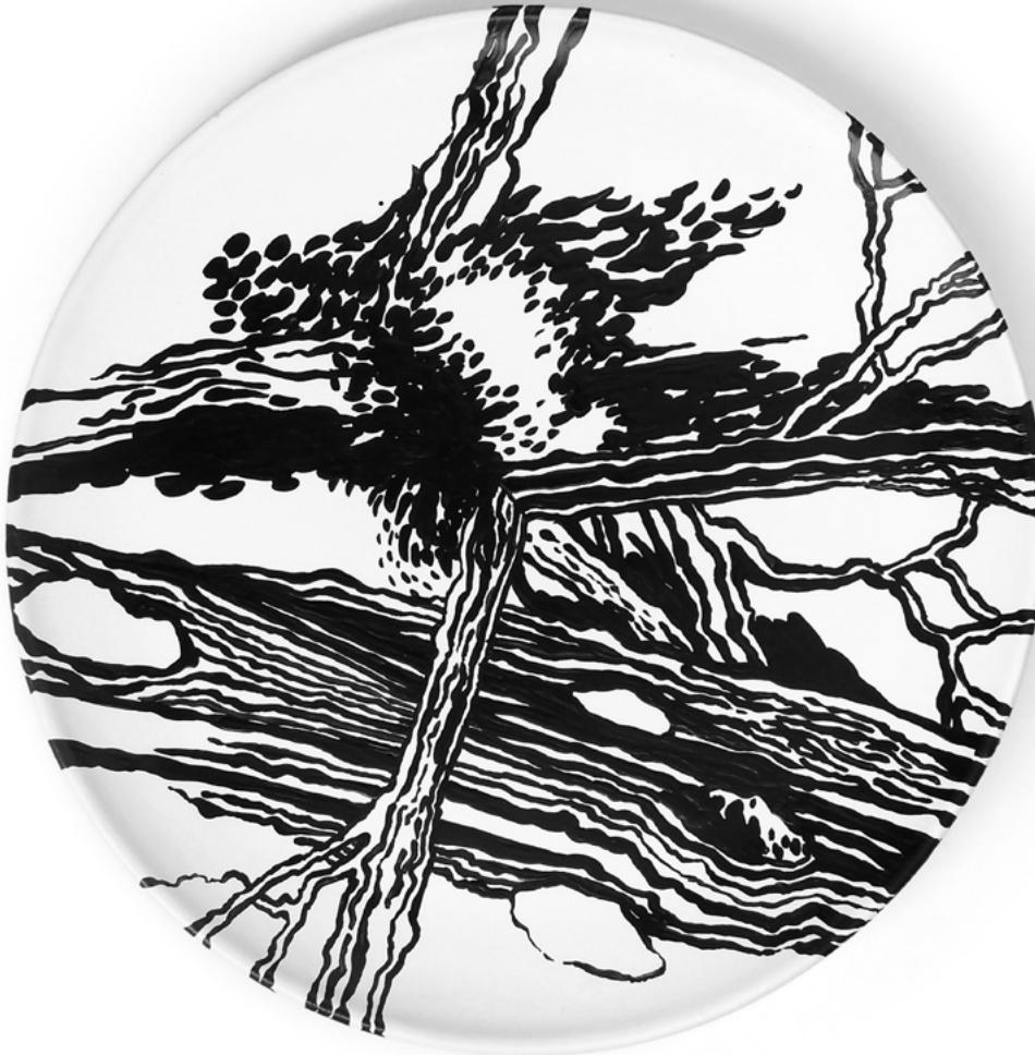
Imagen 2: Cabrera, G. (2018). Dispositivo para domar la intemperie . Río Negro, Argentina.

mayores. ¿Qué ofrece a los artistas contemporáneos que lo hace particularmente seductor para participar en producciones transdisciplinares o puramente gráficas? En busca de una aproximación a posibles respuestas, investigo desde dos apuestas metodológicas paralelas. Por un lado, desde el análisis de producciones de artistas elegidos específicamente por su vínculo con esta ancestral disciplina, indagando en los modos en que participa de manifestaciones contemporáneas diversas. Por otro, desde la práctica artística específica, tensando sus límites, pensando