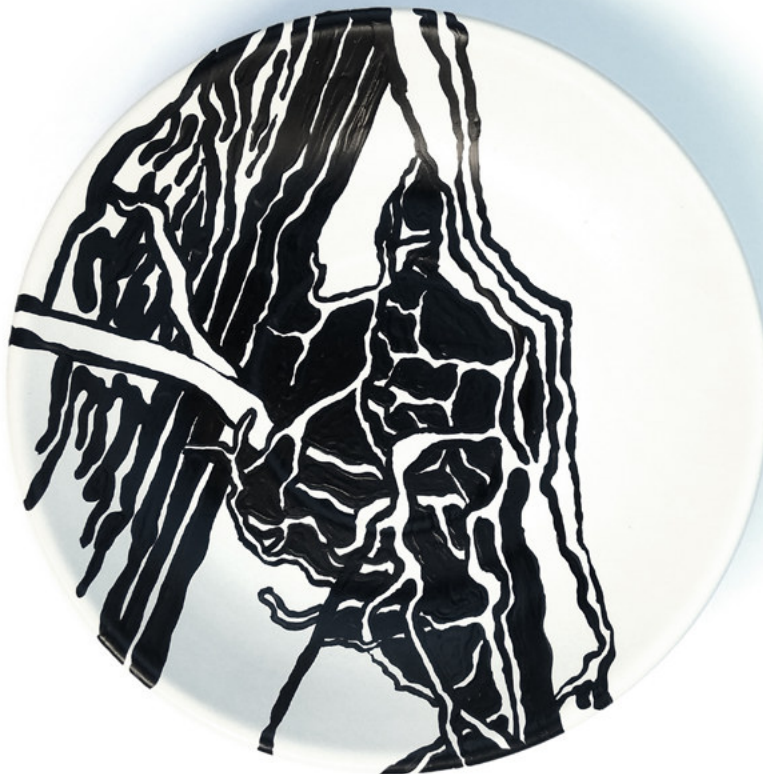
Imagen 4: Cabrera, G. (2018). Dispositivo para domar la intemperie . Río Negro, Argentina.

Elijo pensar en el plato como espacio compositivo donde la naturaleza también se ve ordenada. Aun tratándose de un arte decorativo –y por ello menor–, refleja los mismos valores que el jardín de Versalles. Pero este paisaje, el de la costa del río Negro, carga con una genealogía que fricciona con la historia de paisajes como la cam-