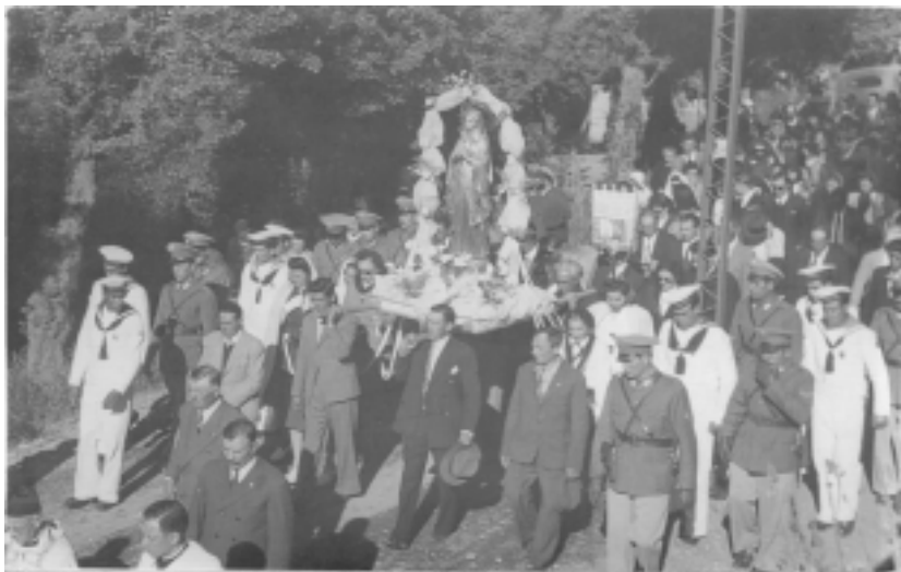
Figura 1. Peregrinación de la Inmaculada 8/12/1945.