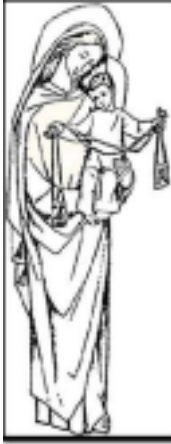
Figura 8. Virgen de Urkupíña