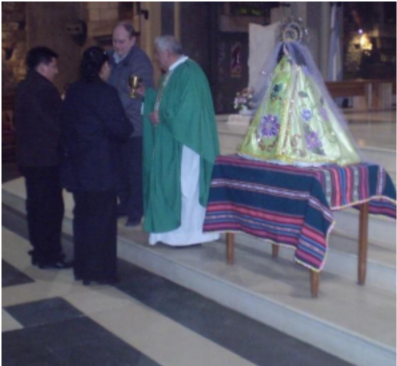
SOCIEDAD Y RELIGIÓN N°57, VOL XXXI (2021)