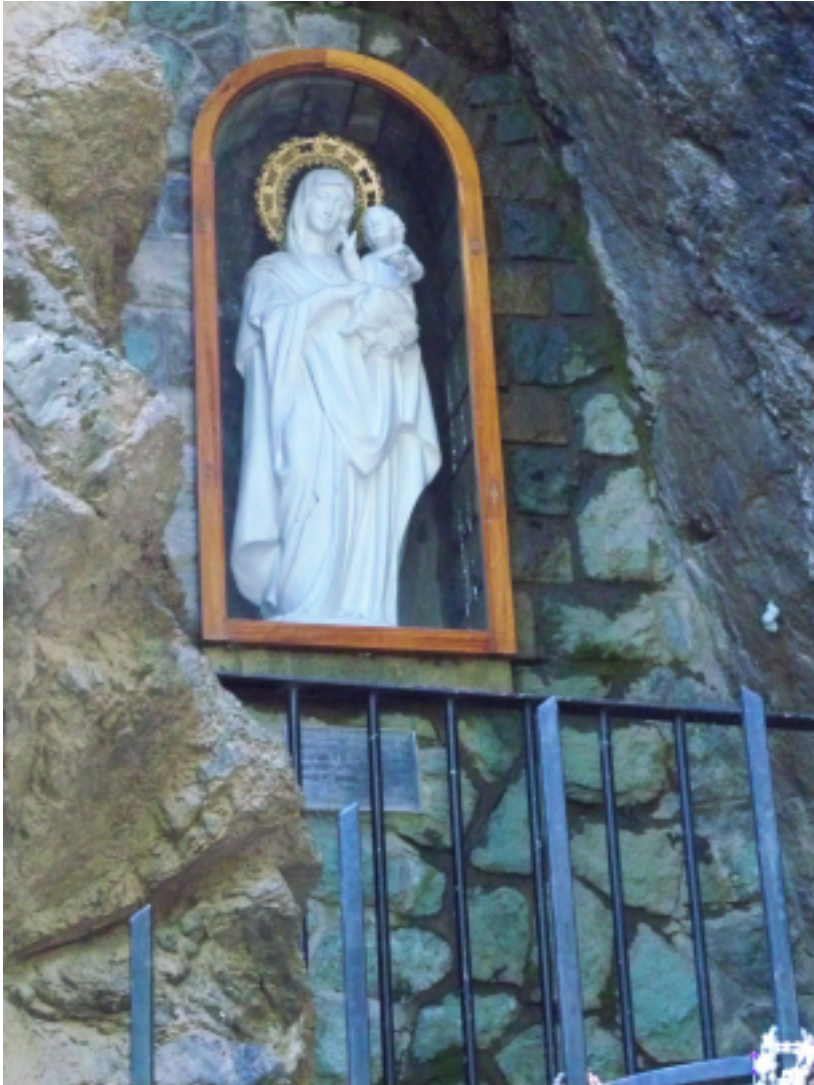
Figura 5. Imagen de la Virgen de las Nieves en su gruta.