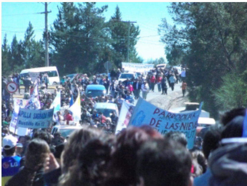
Foto 6. Peregrinación diocesana 2016.