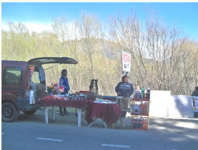
Imagen 7 Puestos de venta