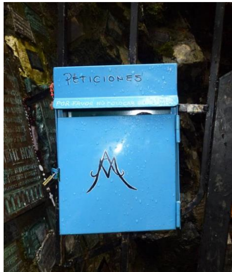
Imagen 8 Buzón de peticiones