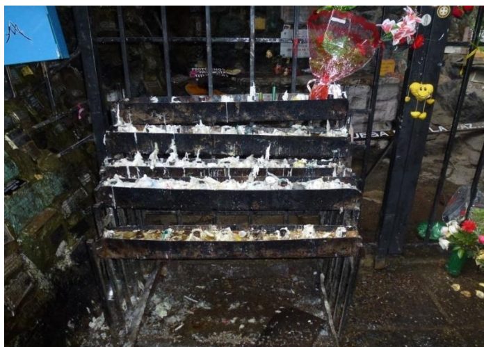
Grupo 2 de exvotos: velas y flores