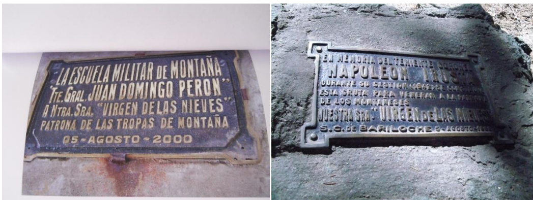
Placa de Napoleón Irusta y del Ejército de Montaña