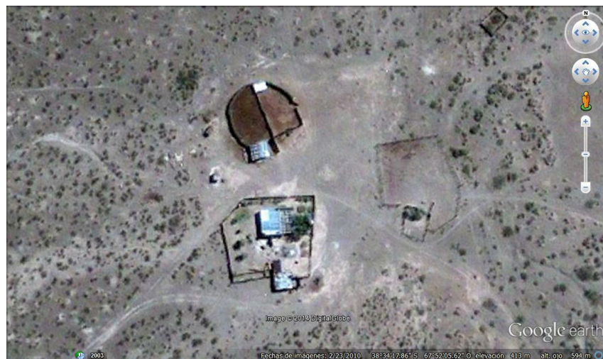
Imagen 2. Imagen satelital del puesto

La Imagen 2 muestra las instalaciones generales del puesto: una vivienda y dos corrales.