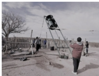
Figura 2. Montaje del molino. (Chrestia et al., 2015)

Compartiremos aquí un tipo de proyecto que venimos realizando desde el año 2014. Se trata de la construcción e instalación de molinos Savonius en puestos rurales de la Patagonia Argentina. Ese año construimos e instalamos el primero. Durante los años 2015 y 2016 construimos otro y al presente nos encontramos construyendo 8 molinos que serán instalados por los estudiantes en puestos rurales. En particular estos proyectos permiten abordar procesos relativamente completos de modelación de manera integral. En efecto, el contexto real y motivador aparece como problemática a resolver. Ese contexto presenta variables relevantes a retener y otras a descartar. El proceso de selección e identificación de las variables relevantes resulta rico en debates en general para los estudiantes. Luego se produce la articulación de las variables para llegar a construir un modelo pertinente. La instancia siguiente consiste en descubrir y analizar nuevas relaciones entre las variables, ya ahora en el marco del modelo para, finalmente, volcar esos análisis a la realidad que lo motivó. Resulta interesante observar cómo esos análisis efectuados en el plano del modelo son muy potentes en términos de relaciones inferidas las que por cierto serían casi imposibles de elaborar si se trabajara en el plano del contexto real. La figura 2 muestra uno de estos molinos al momento de su instalación.