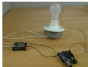
Figura 4. Sistema de control de temperatura de un foco. (Mendoza y Cordero, 2018)

El escenario escolar de esa comunidad de ingenieros, nos ofreció una transversalidad del uso de la estabilidad: la Reproducción de un Comportamiento en un Sistema de Control . Se problematiza el diseño (la instrucción que organiza comportamientos). Esto compone una epistemología de usos , la cual se confronta con la matemática escolar. Reproducción de comportamientos es una categoría de modelación que expresa una matemática funcional ; en ese sentido ecuaciones diferenciales, como ay' = f - y , son el modelo de la reproducción de comportamientos; no se trata de “encontrar la solución que no se conoce”, son instrucciones que organizan comportamientos (Mendoza y Cordero, 2018).