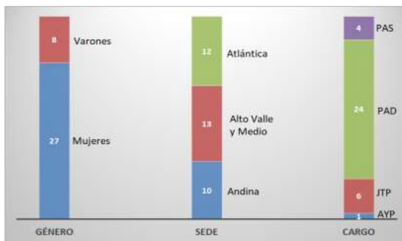
Figura 2. Distribución de inscriptos

Respecto al área disciplinar donde las y los docentes llevan adelante la práctica académica, los resultados incluyen: Abogacía, Arquitectura, Contador Público, Paleontología, Ingenierías (en Agronomía, Ambiental, Biotecnología, Computación y Electrónica), Licenciaturas (en Administración, Comercio Exterior, Economía, Geología, Kinesiología y Fisiatría, Sistemas y Agroecología), Medicina Veterinaria, Nutrición, Odontología, Tecnicaturas (en Viveros,