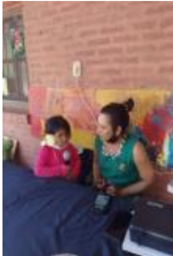
Foto 3. Se animaron a contar el dolor, que ocasiona la muerte de un familiar, por ejemplo

Foto 2. Con el transcurso de los días, la presencia era cada vez mayor, les interesaba poder participar, estaban entusiasmados. Ya que todo el jardín y la escuela podían escucharlos, podían hablar de todo lo que les pareciera interesante.