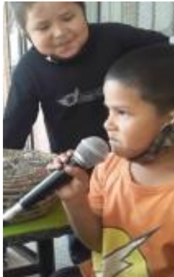
Foto 4. Decidieron ser ellos los locutores y locutoras del programa de radio.

Foto 3. Se animaron a contar el dolor, que ocasiona la muerte de un familiar, por ejemplo