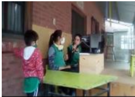
Foto 1. Al comenzar con la experiencia, éramos nosotras (profesora) las encargadas de dar inicio al programa de radio. Los ñaqqoilec (niños, niñas y niñas) se acercaban para poder decir su palabra.

El programa de radio se emitió en tres horarios de la jornada. El primero a las 10:30 horas, el segundo a las 15:30 horas y el tercero a las 17:00 horas. Estos horarios fueron pensados para que todos los turnos de la institución puedan participar de esta experiencia.