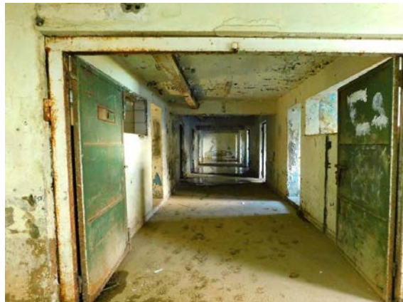
Figura 2. Pasillo de la torre de celdas en 2024.

Los proyectos de financiamiento a los que ha aplicado la agrupación han sido destinados a la restauración edilicia, por una parte, y al trabajo en el archivo de la excárcel, por otra. La intención de los ex presos y sus