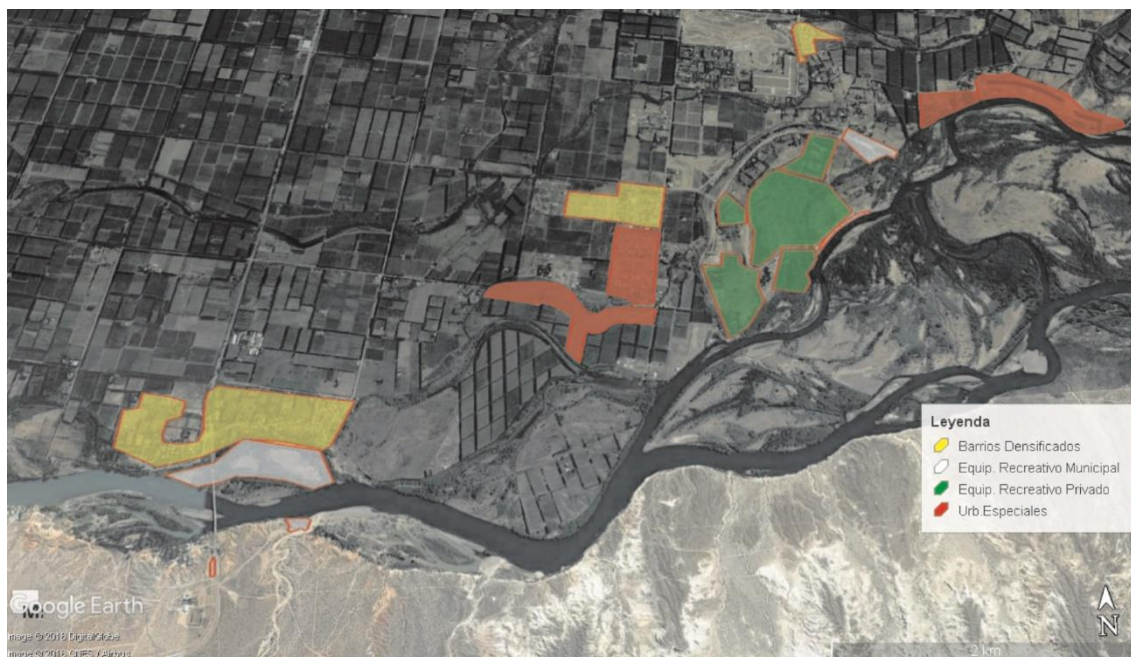
Figura 4. Área ribereña Gral. Roca

su vez la forma de habitar en cada caso. En ambos casos de estudio los sectores delimitados por el color rojo, tanto en Figura 4 y 5 donde pueden apreciarse las urbanizaciones “especiales” y/o barrios privados.