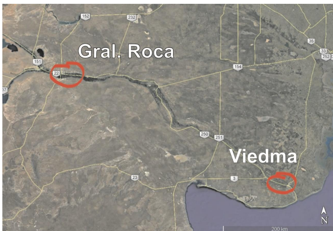
Figura1. Localización de los casos de estudio.

Palabras Claves: Globalización, Territorio, Transformación, Usos, Accesibilidad