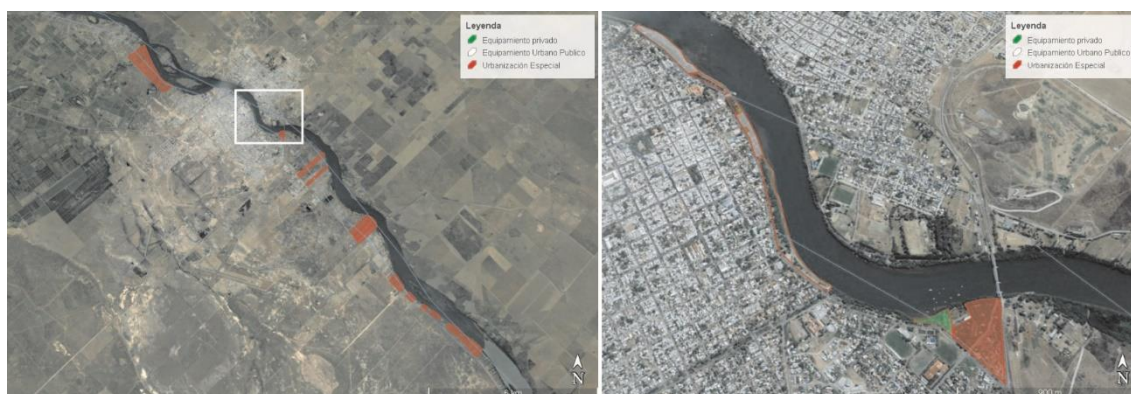
Figura 5. Área ribereña Viedma (Izq.: Rururbano, Der.: Casco céntrico)

Por todo lo analizado se puede establecer con claridad y comparando ambos casos que, a diferencia de Gral. Roca, el área de costas en el territorio de Viedma está seriamente comprometido por urbanizaciones privadas que restan la posibilidad de acceso a los lugares ribereños.