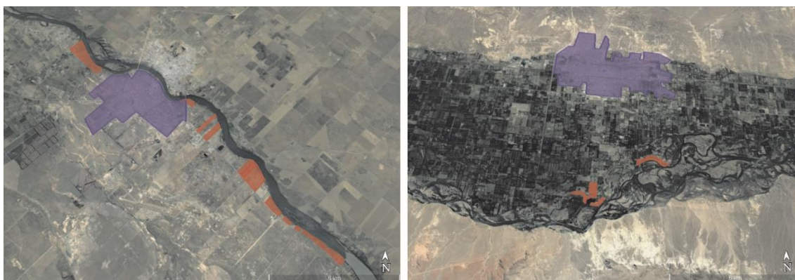
Figura 6. Zona residencial sobre costa de río. Viedma (Izq.), Gral. Roca (Der.)

Como ya se indicó “un lugar puede definirse como lugar de identidad, relacional e histórico...” (Auge, 1992, p.83), los espacios públicos son lugares de convivencia e interacción social por excelencia y en el caso del río Negro, lugares con una fuerte identidad. La pérdida de estos lugares debilita relaciones funcionales referidas a lo social.