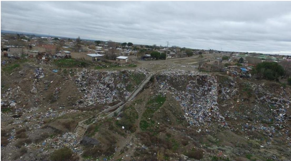
Imagen. La Súper Digital

El resto de los espacios verdes del barrio son residuales, sin tratamiento e incluso algunos representan serios riesgos para la salud y seguridad de los habitantes como el zanjón de calle defensa.