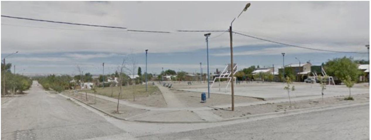
Imagen. Captura propia desde google Street view.

El resto de los espacios verdes del barrio son residuales, sin tratamiento e incluso algunos representan serios riesgos para la salud y seguridad de los habitantes como el zanjón de calle defensa.