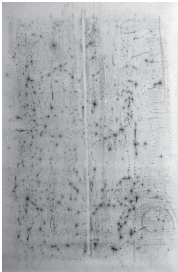
Fina Padrós. Fregament 1 , 2009

“¡Oh luz manifestada! / que iguala al ojo con el sol.” 39